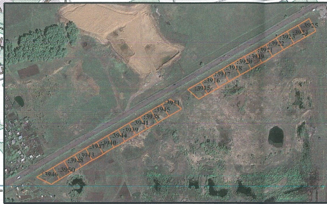
СХЕМА размещения земельных участков, государственная собственность на которые не разграничена, предоставляемых в собственность бесплатно отдельным категориям граждан для дачного строительства в соответствии с Постановлением Администрации города Омска от 18.07.2016 года № 883-п