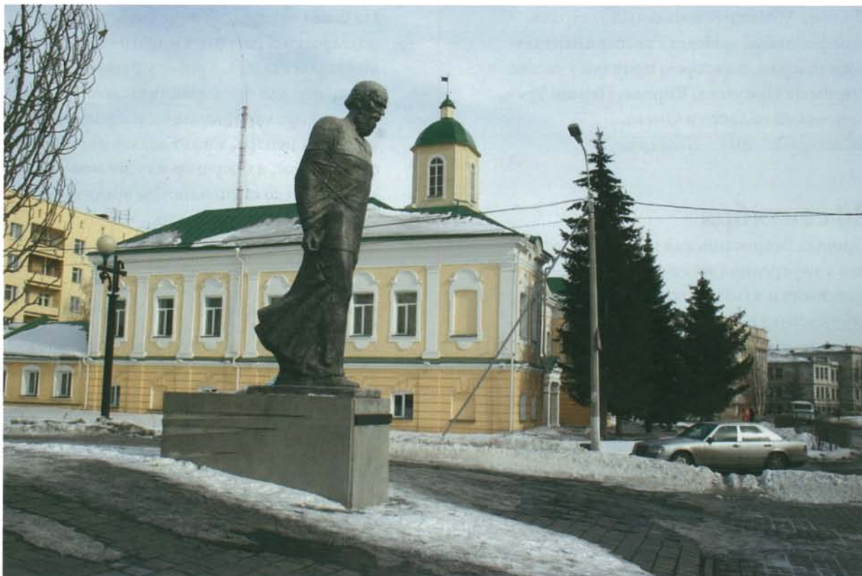
Памятник Ф. М. Достоевскому