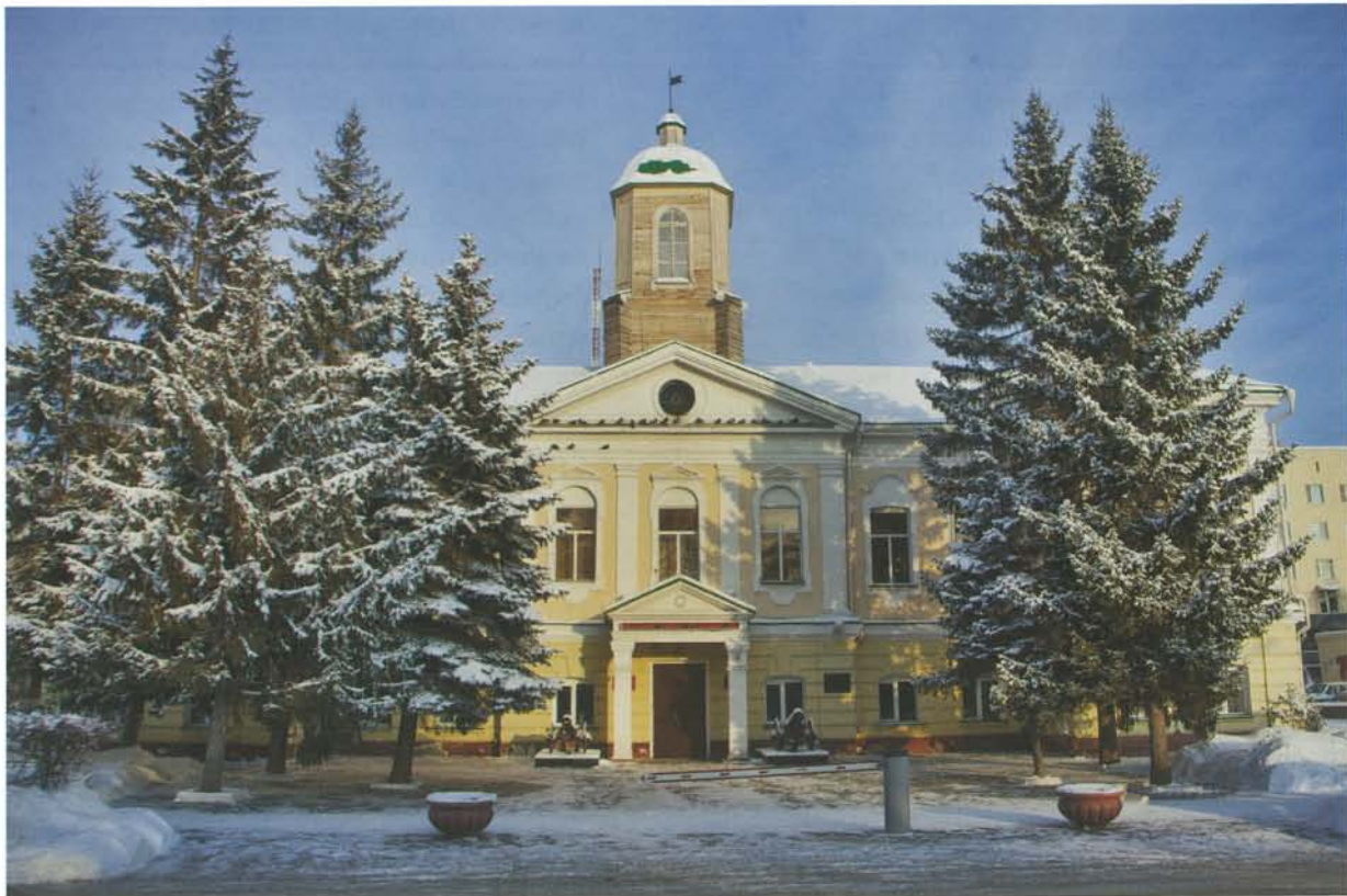
Здание гауптвахты XVIII века. Сейчас здесь располагается Военный комиссариат Омской области

Криминал-экспресс [Омск]. – 2011. – 2 марта.