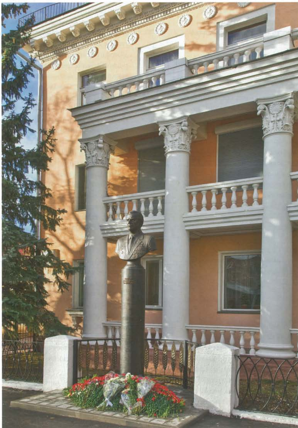
Памятник С. И. Манякину

Коммерческие вести [Омск]. – 2011. – 6 июля (№ 26).