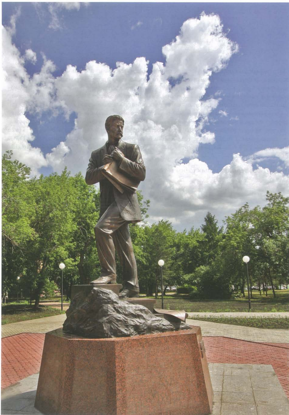
Памятник М. А. Врубелю