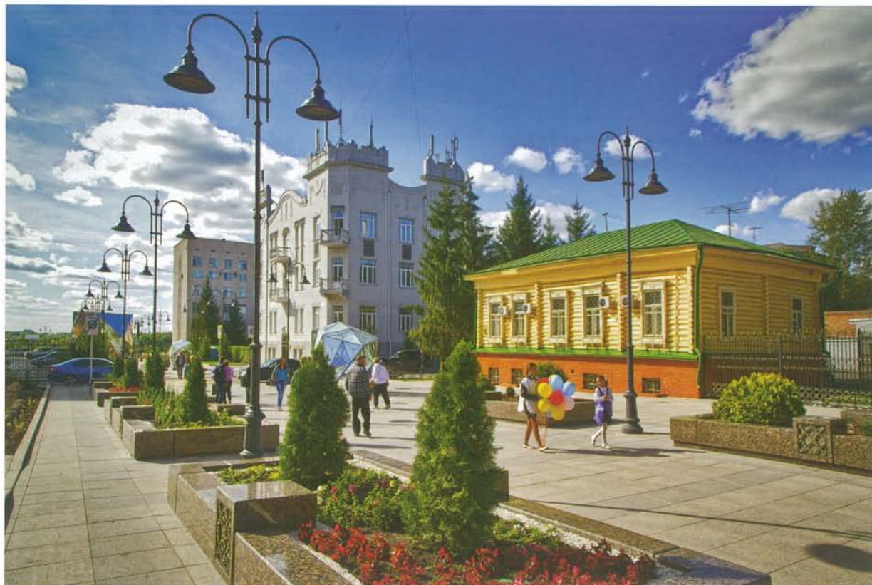
Улица Чокана Валиханова

Знаменательные и памятные даты Омского Прииртышья, 2011. – Омск, 2010.