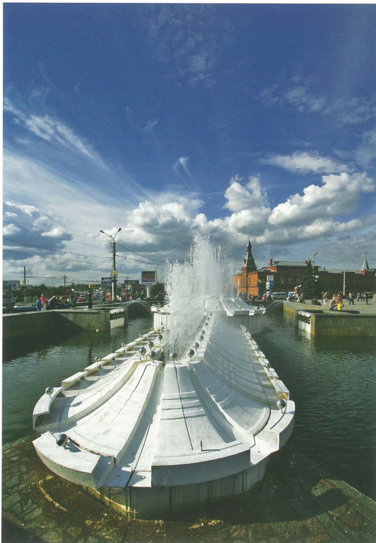
Фонтан у Музыкального театра