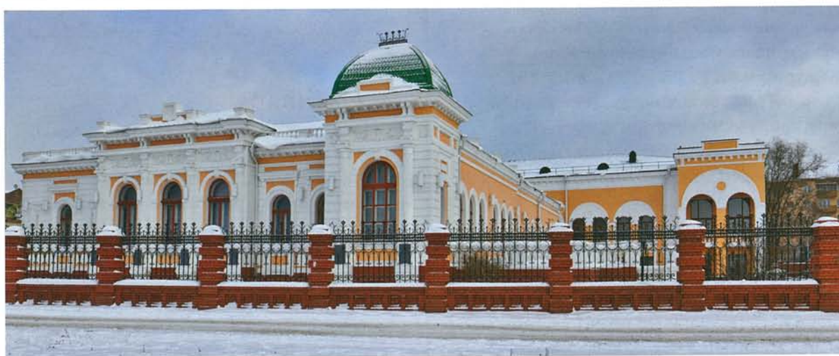
Общественное здание купца Батюшкова. Сейчас в этом здании располагается Центр изучения истории Гражданской войны

Омск театральный. – 2015. – Март (№ 39).