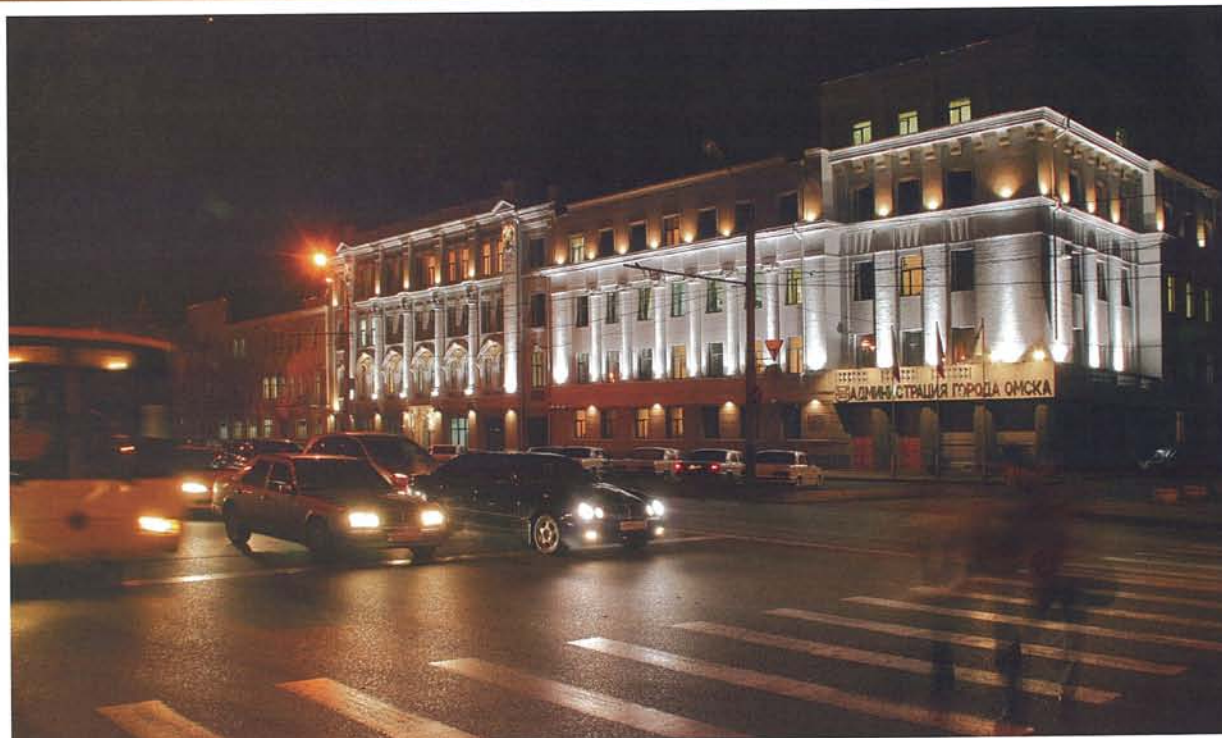
Администрация города Омска