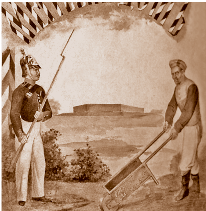
М. С. Знаменский. «Мертвый дом». Конец 1860-х гг. Бумага, акварель. Из фондов ТГИИМЗ*

В роли раздражителей общественного спокойствия, а более всего спокойствия представителей властных структур вновь выступили поляки в результате второй (после начала 1830-х гг.) массовой волны их ссылки в Сибирь, пришедшейся на 1860-е гг. Неудачное восстание в русской части польских земель, входивших в состав Российской империи, привело к тому, что в Омск сослали свыше 2 тыс. чел. Во второй половине 1860-х гг. в Омске, как и в ряде других городов края, была создана следственная комиссия, занимавшаяся раскрытием якобы готовившегося заговора ссыльных поляков. Как говорится, «гора родила мышь»: к началу мая 1867 г. арестовали 11 «заговорщиков». Никаких весомых доказательств антигосударственной деятельности арестованных властям не удалось