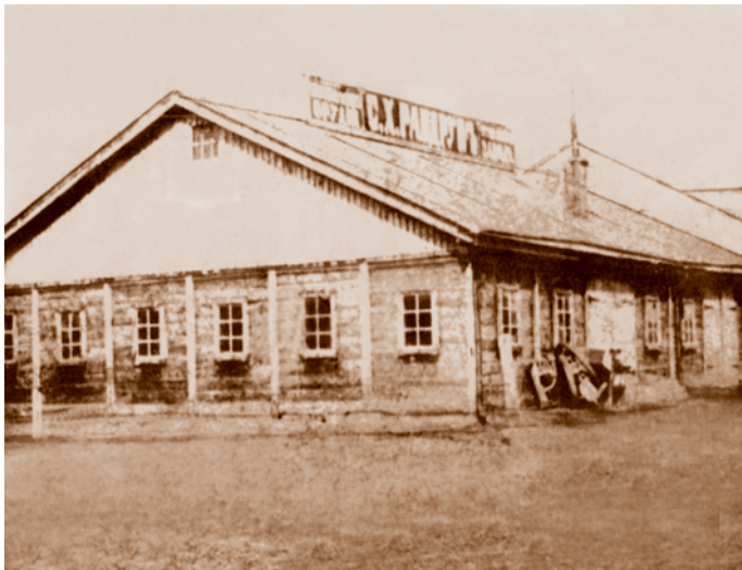
Первый корпус плугостроительного завода С. Х. Рандрупа. Сгорел в 1908 г. Из книги «Между прошлым и будущим» . ОАО «Омскагрегат»» (Омск, 2001)

подполья. К лету 1914 г. представителям партийной интеллигенции и рабочим, участвовавшим в деятельности подполья, удалось преодолеть противодействие ликвидаторов и добиться принятия решения о необходимости усилить деятельность подполья, сочетая нелегальные методы партийной работы с использованием легальных возможностей.