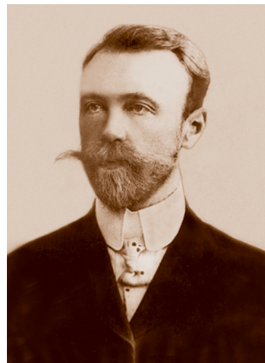
В. И. Ишерский (1872 (74)–1942) – депутат I Государственной думы от социал-демократической партии.

Сформированные организации кадетов (партия Народной свободы) и октябристов (Союз 17 октября), а также отказавшиеся к этому времени от бойкота выборов социал-демократы (РСДРП) вступили в борьбу за голоса избирателей на выборах в I Государственную думу. Согласно избирательному закону, Акмолинская область, административным центром которой являлся Омск, могла делегировать в Думу всего двух депутатов: одного от городских