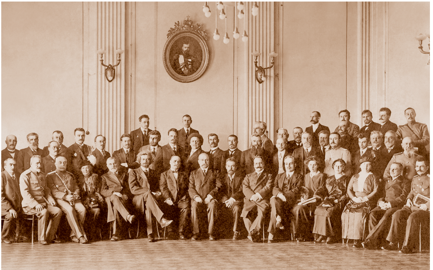
Делегаты I съезда городов Сибири. Омск. Апрель 1915 г.

В 1915 г. обстоятельства военного времени продолжали быть фактором, который сдерживал перерастание недовольства рабочих дороговизной жизни в забастовочную борьбу. В июне столяры вагонного цеха железнодорожных мастерских обратились к начальнику мастерских