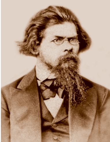
Г. Н. Потанин (1835–1920) – выпускник Сибирского кадетского корпуса, путешественник, этнограф.