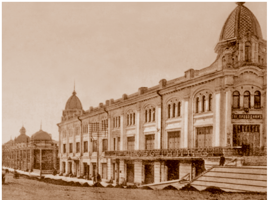
Магазин фабрично-торгового товарищества «Братья Овсянниковы и Ганшин с сыновьями» на Любинском проспекте.

Несмотря на полицейские репрессии, активную работу в массах продолжали вести омские социал-демократы.