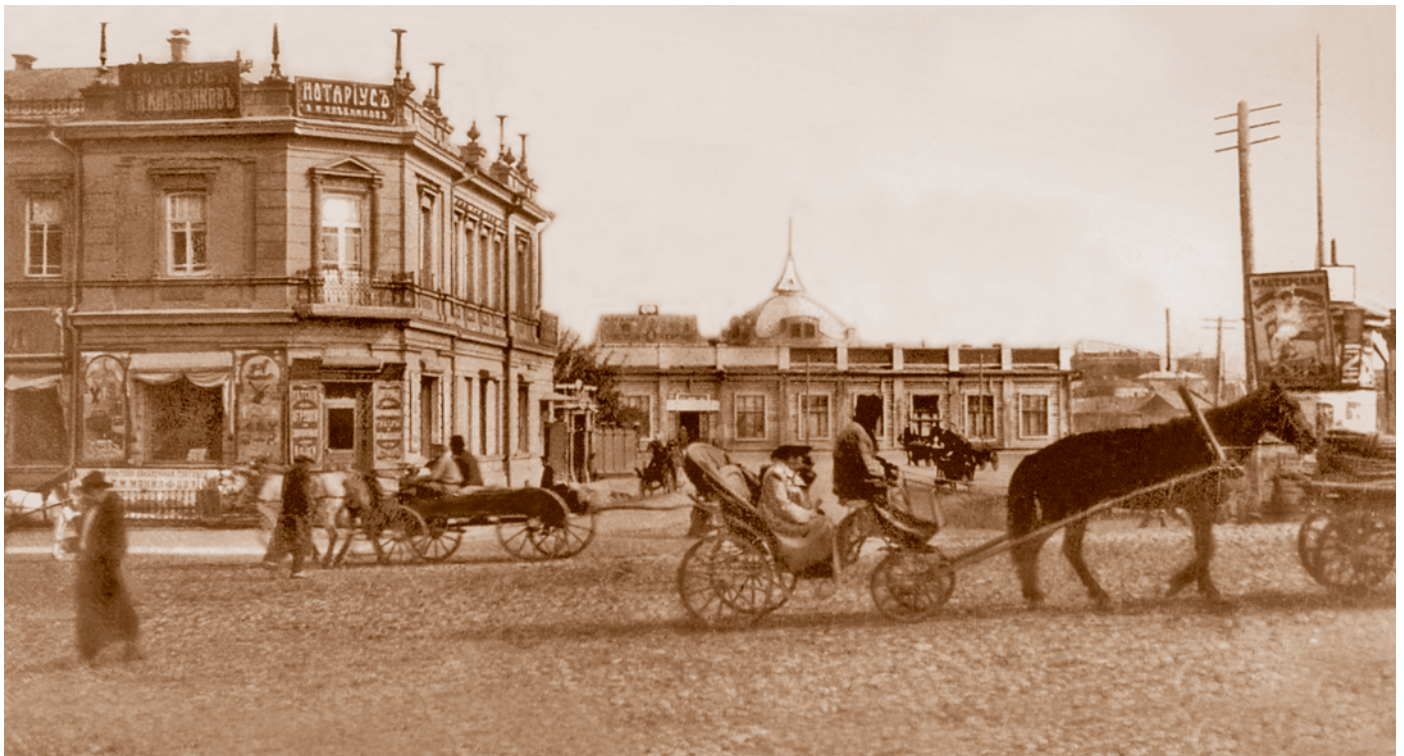
Любинский (Чернавинский) проспект (сейчас – ул. Ленина). Открытка начала XX в.

Если в начале 1916 г. от Государственной думы ждали постоянной работы в целях «организации всех общественных сил», то к концу года такая неопределенность задач, стоявших перед Думой, не устраивала. Основным требованием общественности становится создание кабинета, ответственного перед Государственной думой, т. е. достижение не только бюджетного, но и кадрового парламентского контроля над правительством. На заседании городской думы Омска 15 ноября 1916 г. в итоге обсуждения общеполитической ситуации в России было решено передать по телеграфной связи председателю Государственной думы постановление о поддержке Омской городской думой Государственной думы, которая видела источник государственного беспорядка, разрушителя успеха армии в деятельности безответственных советчиков. Отправлявшемуся в Петроград председателю военно-промышленного комитета Н. Д. Буяновскому гласные думы поручили передать М. В. Родзянко копию постановления. Постановление Омской городской думы было отменено Акмолинским областным по городским делам