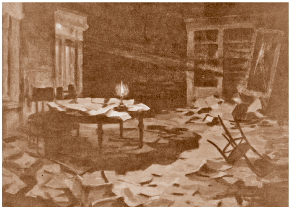
Н. А. Касаткин. После обыска. 1905.