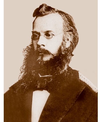
Н. М. Ядринцев (1842–1894) – публицист, исследователь Сибири.

В 1865 г. в Омске проходил один из самых крупных политических процессов в России, где рассматривалось «Дело об отделении Сибири от России и образовании республики, подобно Соединенным Штатам». В числе других сибирских сепаратистов были арестованы идеологи сибирского областничества Г. Н. Потанин и Н. М. Ядринцев. Оба были приговорены к ссылке. Над Потаниным перед отправлением в ссылку на базарной площади (на месте нынешней площади Бухольца) был совершен обряд гражданской казни