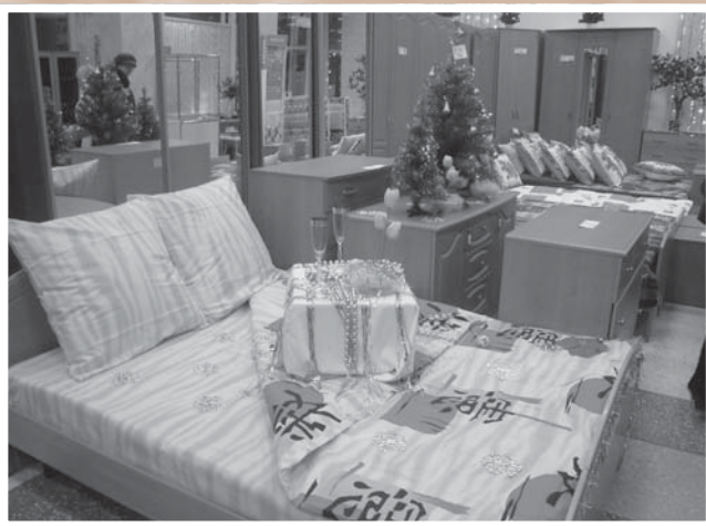
Образцы мебели для спален. Магазин «1000 мелочей» ЗАО «Торговая фирма «Хозмебельстройторг»» (ул. Ленина, 53)