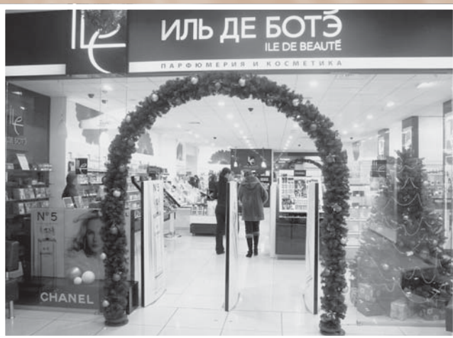
Праздничное оформление входа в бутик парфюмерии «Иль де Ботэ» в комплексе «Герцен-Plaza»