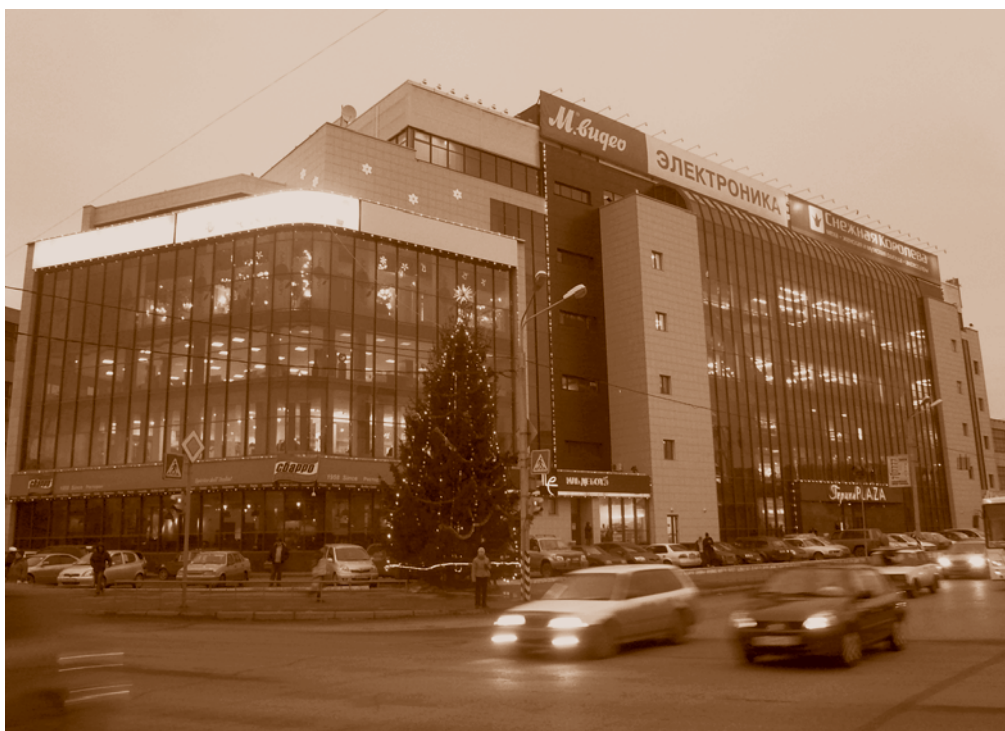
Современный торгово-офисный комплекс «Герцен-Plaza» (ул. Герцена, 34). Ранее здесь располагались цеха завода им. Н. Г. Козицкого

В этот период индивидуальные предприниматели и различные торговые фирмы начали массовые поставки импортных товаров широкого ассортимента. Город открылся огромным количеством киосков, в которых совершенно бесконтрольно продавалась продукция, в том числе и самого низкого качества, особенно спиртные напитки, что приводило к многочисленным случаям отравления людей, нередко с летальным исходом. Все этажи