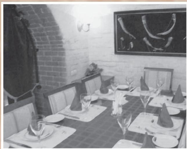
Банкетный зал ресторана «Мимино» (ул. Ленина, 22)*. Открыт в 2004 г. Предлагает прежде всего блюда грузинской кухни

Шкуренко» и др.), что позволило значительно улучшить сохранность продовольственной продукции на пути от производителей сырья и полуфабрикатов до потребителей.