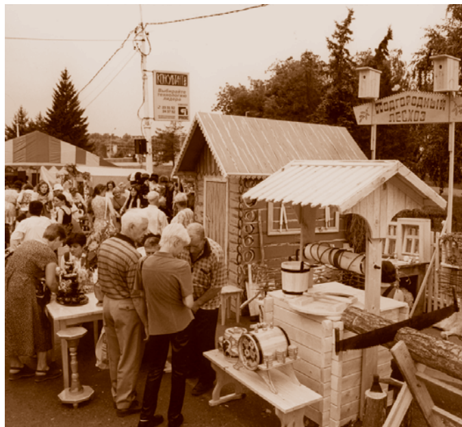
«Ярмарка ремесел» в Выставочном сквере. День города – 2001. Из фондов МИСО

Кроме предприятий розничной торговли продолжают работать и рынки. Рыночная торговля также претерпевает значительные изменения в сторону улучшения организации и культуры обслуживания. В городе 19 рынков, тор-