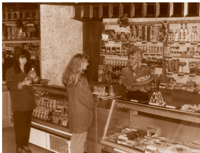
Торговый зал кафе «Парус» на территории Первомайского рынка. Фотография 1993 г.

В связи с разгосударствлением всей системы торгового обслуживания в Омске были ликвидированы городское и областное управления торговли. Все торги, магазины, торговые базы и другие предприятия системы были приватизированы и начали работать самостоятельно. Естественно, что многие из них, не имея опыта работы в новых условиях, быстро обанкротились, некоторые перепрофилировались, налаженная система нормированного обеспечения торговыми площадями по видам товаров перестала существовать. Потребительский рынок товаров и услуг вышел на саморегулирование в зависимости от потребительского спроса.