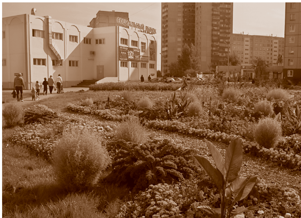
Социальный рынок Левобережья (микрорайон № 12).

Для удобства садоводов количество мест для сезонной мелкорозничной торговли на городских рынках доведено до 1 200. Получила развитие система современных складских комплексов («ПродоСибирь», ООО «Торговый дом