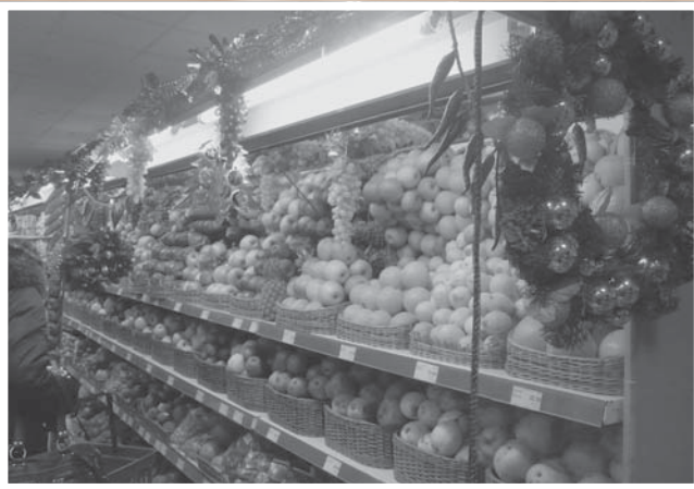
Отдел по продаже овощей и фруктов в круглосуточном супермаркете ТК «Алладин» (проспект Мира, 100)