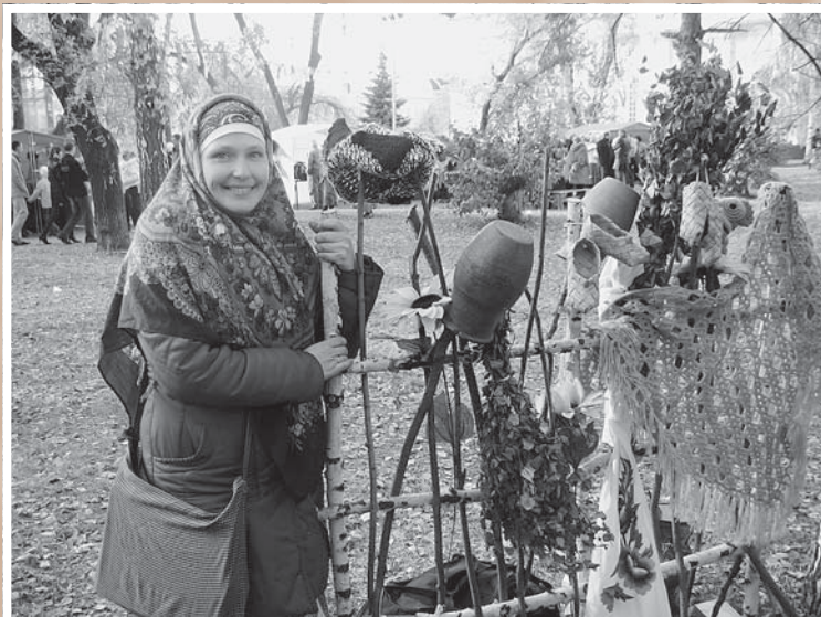
Покровская ярмарка. У плетня с изделиями народных мастеров. Омск, 13 октября 2007 г.