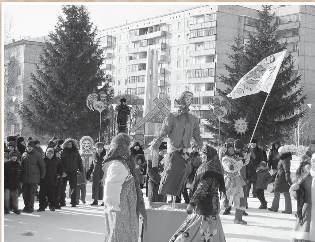
«Масленица-мокрошейка, пошла прочь со двора!» . В прошное воскресенье у Дома дружбы. Омск, февраль 2007 г.