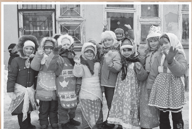
Праздник «Масленица» в детском саду № 264 в рамках проекта ОГОО «Дар» «Охрана здоровья – дело общее».