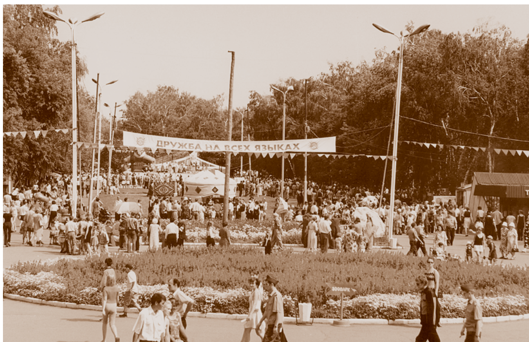
Фестиваль «Дружба на всех языках». Омск, Парк культуры и отдыха им. 30-летия ВЛКСМ. 2005.

Направления деятельности социума, способствующие актуализации этнических традиций в современной культурной жизни города, разнообразны: организация фольклорно-этнографических экспедиций и детских фольклорных лагерей, издание научно-методических пособий, проведение народных праздников и фольклорных фестивалей, создание фонда фольклорно-этнографических материалов и специализированных телевизионных передач, организация выставок декоративно-прикладного искусства и семинаров-практикумов по разным видам ремесел, участие мастеров и предприятий народных художественных промыслов в выставках-конкурсах и ярмарках, создание центров традиционной культуры и творческих коллективов, развивающих народные традиции. Но для сохранения того малого слоя народной культуры, который еще существует, а тем более для воссоздания утраченных традиций необходим целый комплекс мероприятий региональных и федеральных властей, а также – ряд факторов социально-экономического, политического, социокультурного порядка, которые будут способствовать выработке национальной идеологии российского общества, основанной на симбиозе лучших этнических традиций.