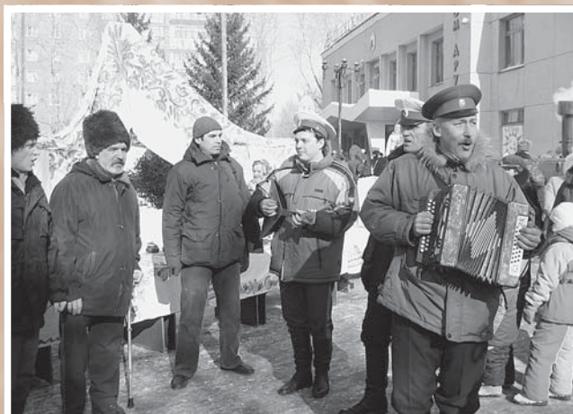
Выступление народного фольклорно-этнографического ансамбля «Ермак» Казачьего культурного центра. 2009