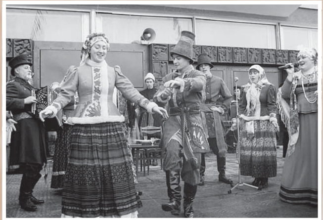
Покровская ярмарка. Поет фольклорный ансамбль «Звонница» факультета культуры и искусства ОмГУ им. Ф. М. Достоевского. Омск, 14 октября 2006 г.