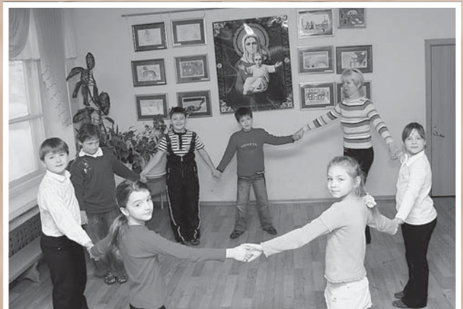
На уроке в Славянской школе Кирилла и Мефодия (ул. Красных Зорь, 54а).