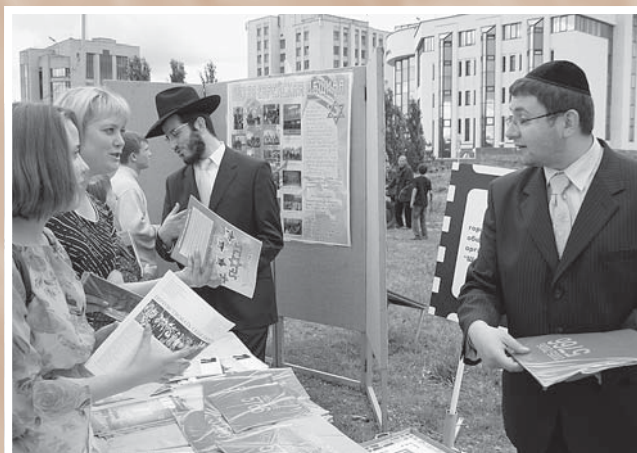
День города – 2006. Уголок омской еврейской общины