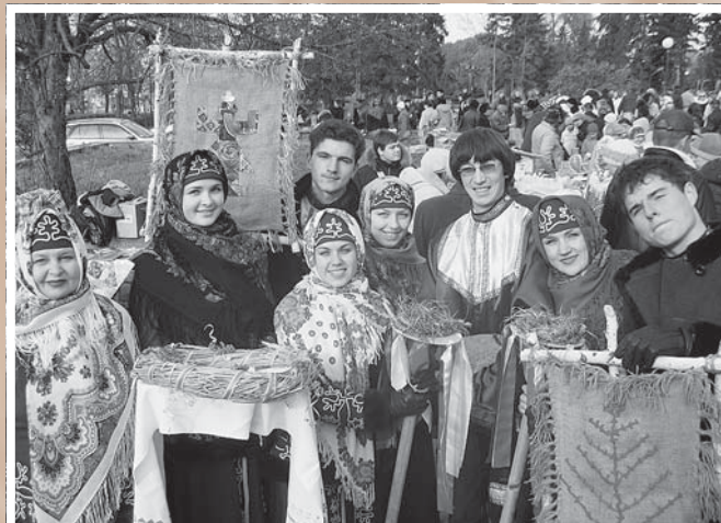
«Батюшка Покров, покрой нашу избу теплом, а хозяина – добром!» . Покровская ярмарка у краеведческого музея. Омск, 14 октября 2006 г.