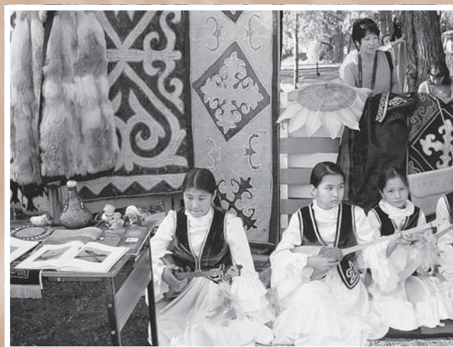
Казахский музыкальный ансамбль в настоящей юрте. 2005