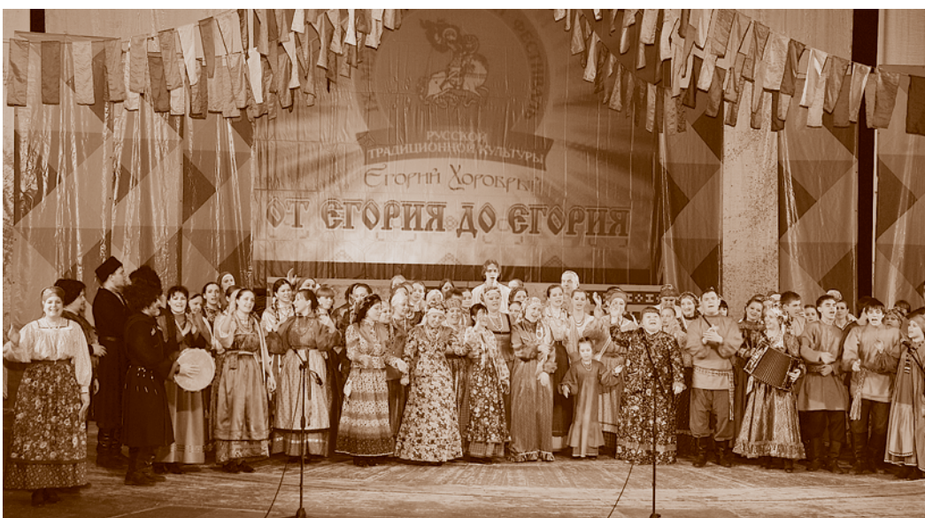
«Мы по полю ходили, Егорья искали...». Выступление участников фестиваля «Егорий Хоробрый» на сцене ТюЗа. Омск. 2009.

В последние годы популярностью стали пользоваться большие сибирские хороводы, которые устраиваются на съездем празднике «Троицкие гуляния» в Омске, Большеречье, Муромцево. В 2008 г. в День России троицкие хороводы объединили на Соборной площади Омска более 300 чел. Возросший интерес к народным ремеслам в Омске и области нашел свое отражение в возникновении межрегионального праздника традиционных ремесел «Покровская ярмарка», организуемом министерством культуры Омской области с 2005 г. В программе праздника мастер-классы по бытовой хореографии, уральской росписи по металлу, резьбе по дереву, лозоплетению, бисероплетению, браному ткачеству, фольклорному театру и т. д. В рамках праздника проводится конкурс народного костюма «Этностиль», демонстрирующий поворот к изучению местных традиций, интерес к живому бытованию этнических элементов в современном костюме.