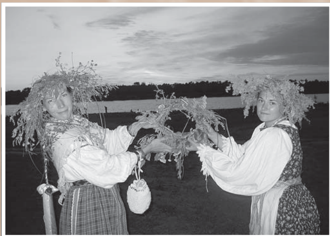
«Сегодня Купала, завтра Иван, будет, парни, лихо вам...». Праздник Ивана Купалы в летнем палаточном военно-патриотическом фольклорном лагере «Богатырская застава». Поселок Ильинка, 5 июля 2008 г.