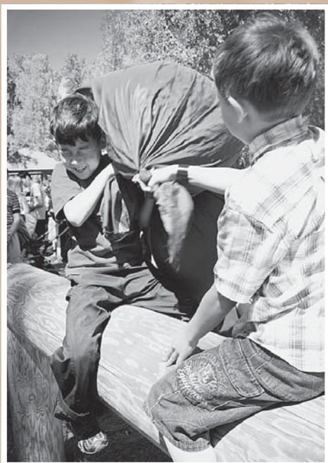
Татарский национальный праздник «Сабантуй».