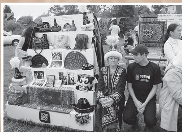
Выставка Сибирского центра казахской культуры «Молдир». День города – 2006