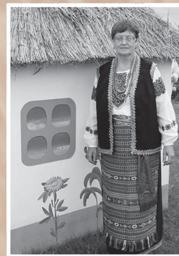
Сибирская украинка у стилизованной мазанки. 2006