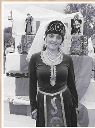
Представительница армянской диаспоры. 2006