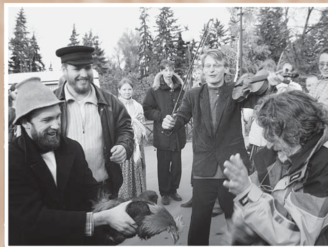
Покровская ярмарка. Забавы с петухом. Омск, 14 октября 2006 г.