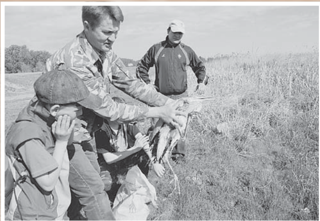
Возвращение в природу. Волонтер Общества охраны природы Сибири выпускает вылеченную птицу за поселком Розовка.