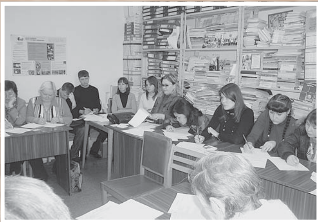
Семинар для общественных организаций. Ноябрь 2009 г.