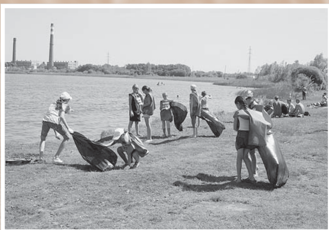
Акция по благоустройству озера Чередовое. 10 июня 2009 г.

интеллектуальный экологический марафон «Эколог года», экологические спектакли, лагеря и экспедиции, выставки, научно-практические конференции, семинары, круглые столы; издаются рабочие тетради, учебно-методическая литература (с 2004-го по 2007 г. издано 840 сборников, 475 плакатов, 350 рабочих тетрадей, 280 буклетов).