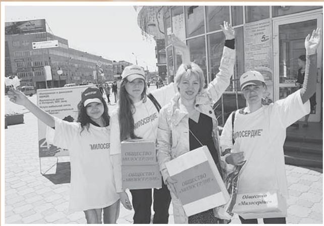
«Помоги больным детям!». Акция «Белый цветок – символ надежды» проводится ежегодно 1 июня обществом «Милосердие».