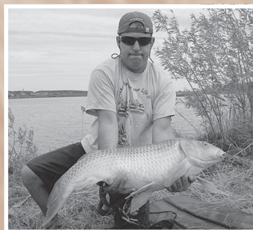
Чемпионат Омска по карпфишингу. 22 августа 2009 г. Организатор – региональная общественная организация «Сибирский карповый клуб».