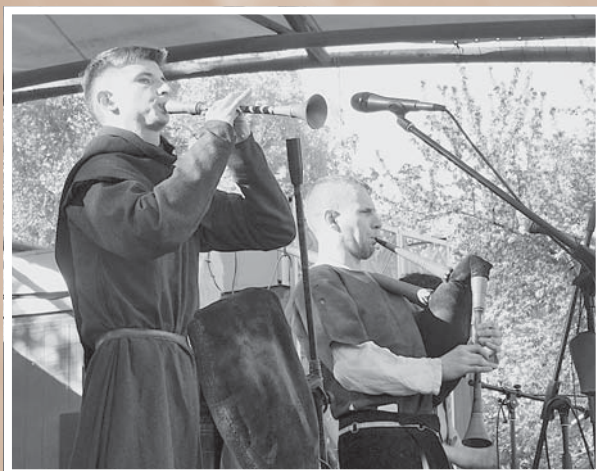
Выступает фолк-группа «SpieleBand»