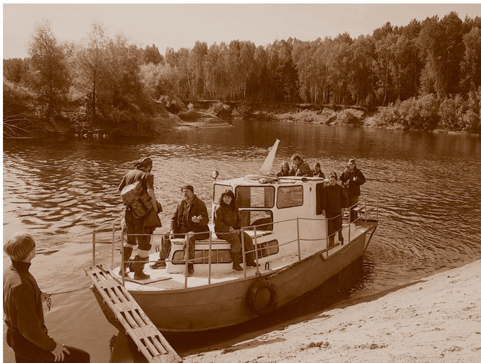
Ревизия особо охраняемых природных территорий участниками экспедиции Омского отделения РГО. Муромцевский район, р. Тара, 2007.

Общественная организация «Клуб путешественников “Мир приключений”» была создана в 1995 г. как молодежная комиссия Омского регионального отделения РГО, направления деятельности которой – спортивно-патриотическое (горная подготовка допризывной молодежи – проведены 15 горных лагерей в районе курорта Боровое, программы горных лагерей, альпиниад, туриад, соревнований и походов на территории Омска, Омской области и горных районов СНГ), краеведческо-исследовательское (экспедиции по заданиям Омского отделения РГО), социально-реабилитационное (адаптация детей – инвалидов по слуху,