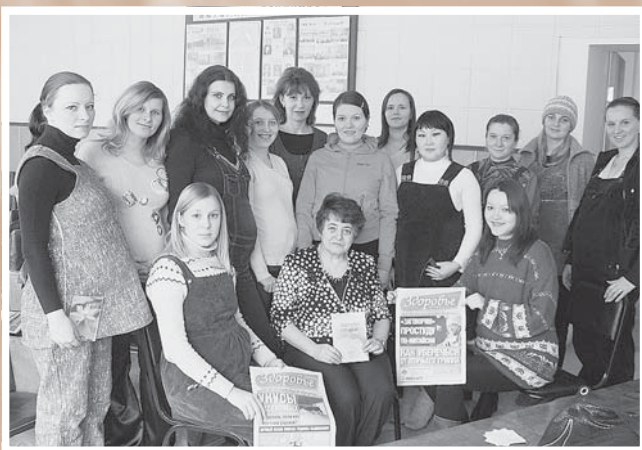
После знакомства будущих мам с проектом ОГОО «Дар». Школа матерей в городской женской консультации № 1. Из архива ОГОО «Дар»