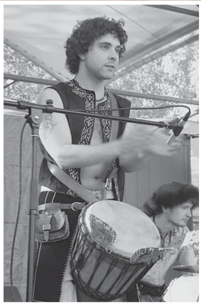
Школа этнических барабанов «Drum'n Pipe»