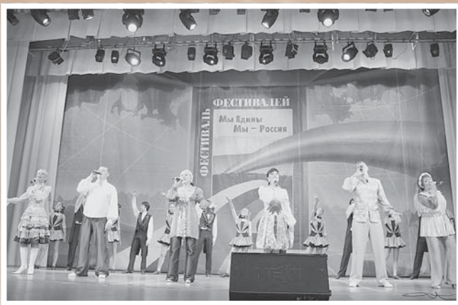
Фестиваль-конкурс патриотической песни «Россия молодая».

Вышли уже 32 номера печатного органа ОФ РФК – пресс-бюллетеня «Вестник культуры», распространяющегося бесплатно через музеи, библиотеки, вузы.