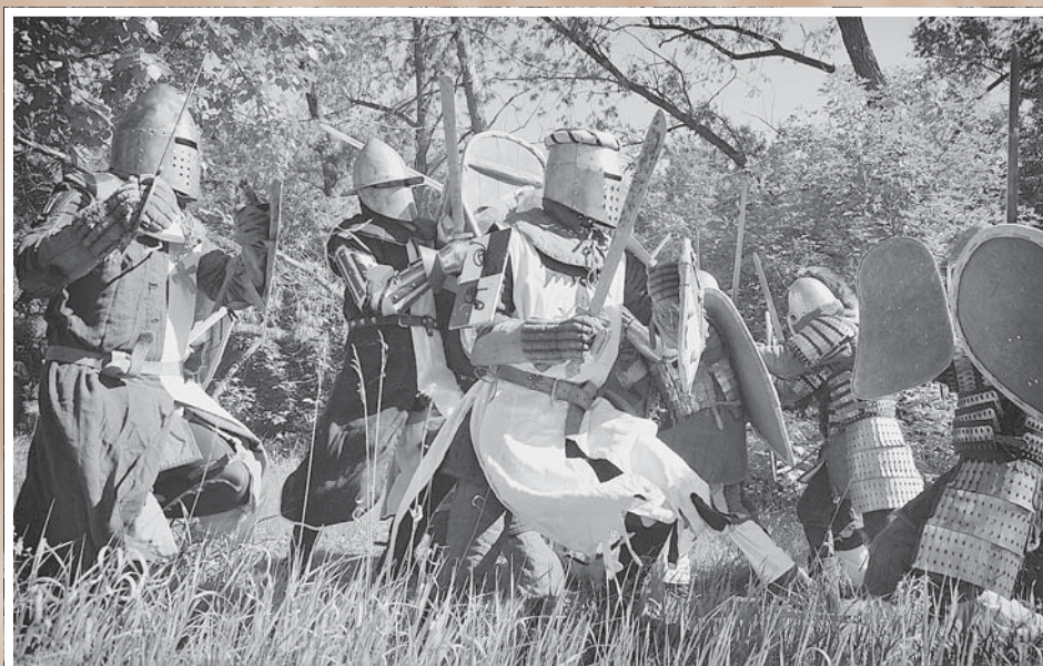
Военно-исторический клуб «Братина». Ледовое побоище в парке Победы