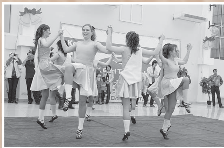
Студия исторического старинного танца «Галианта»