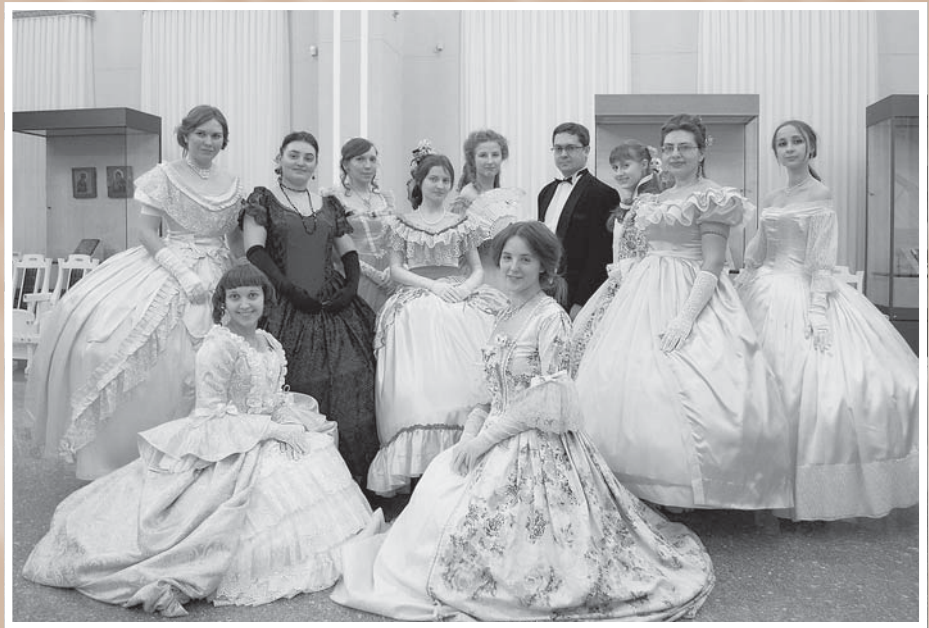
На бал приглашает студия танца «Галианта»