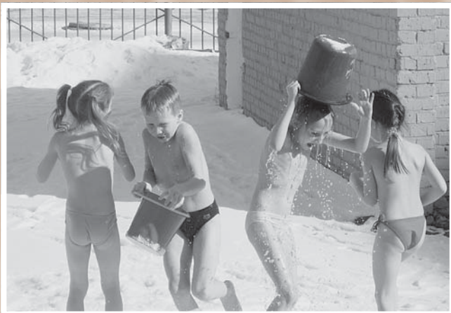
Зимнее закаливание в детском саду № 341 – проект ОГОО «Дар» – «Охрана здоровья – дело общее».

на территории области в реализации программ, проведении благотворительных акций и оказывали поддержку в улучшении материально-технической базы комитета. В течение последних лет были разработаны программы «Дети-инвалиды», «Дети-сироты», «Участие РОКК в профилактике туберкулеза и ВИЧ-инфекции», «Помощь вынужденным мигрантам», «Молодежь в борьбе против наркотиков» и др. Организацией проводятся благотворительные акции: 1 декабря (Всемирный день борьбы со СПИДом), новогодние елки, Международный день защиты детей, летние оздоровительные лагеря. Более тысячи детей ежегодно посещают благотворительные спектакли. При областном Комитете функционирует служба розыска.