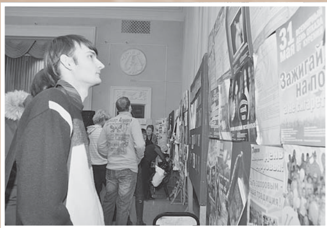
Ярмарка некоммерческих организаций. 2007. Стеновая презентация