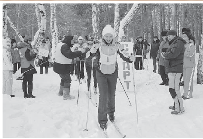
Старты XXXVIII зимней спартакиады обкома профсоюза. 2009