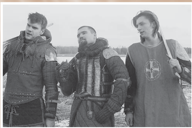
Военно-исторический клуб «Кованая рать». Из архива городской администрации