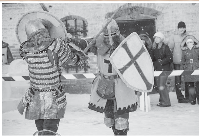
Рождественский турнир на территории культурно-исторического комплекса «Омская крепость». Организатор – военно-исторический клуб «Братина»