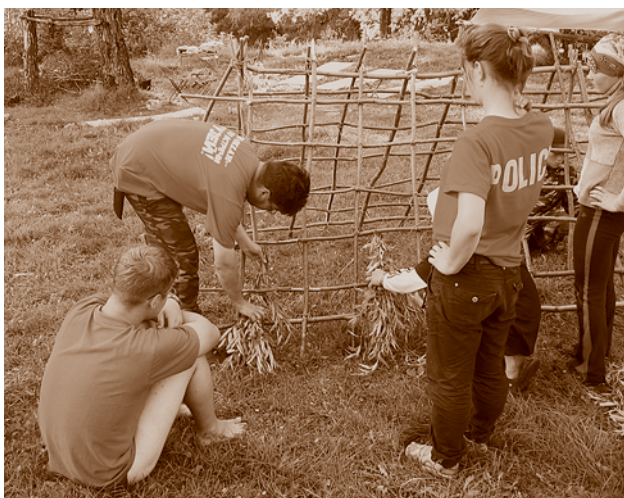
Лагерь «Основы выживания на природе. Обучение постройке жилища» скаутского отряда «Дискавери». Усть-Ишимский район. Август 2009 г.

Цель детской областной общественной организации «Научное общество учащихся “Поиск”» (создана в 1968 г., зарегистрирована в 1996-м) – активизация познавательной деятельности учащейся молодежи, интеллектуальное развитие и поддержка талантливых и одаренных детей. Основные формы деятельности – научно-практические конференции школьников и учащейся молодежи, выездные