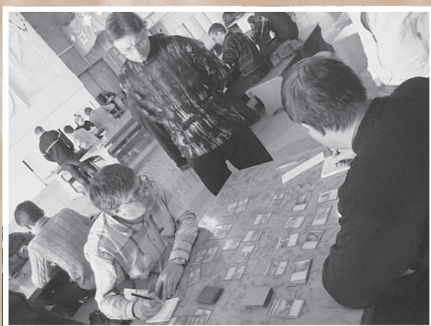
Клуб настольных интеллектуальных игр «Авалон». Чемпионат по настольным играм. 2007