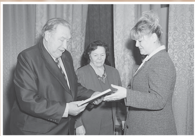
Подведение итогов благотворительного сезона