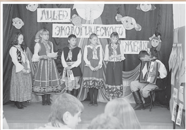
Конкурс «Лидер экологического движения» XV межрегионального экологического фестиваля детско-юношеского творчества «Белая береза».