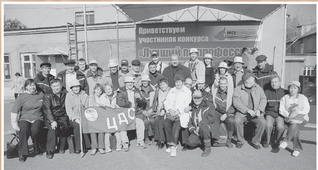
Участники конкурса «Лучший по профессии» в ОАО «ОмскВодоканал». 21 марта 2006 г.