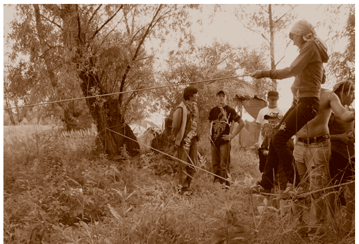
Учебно-тренировочный лагерь «Прогулки по Павловскому парку» скаутского отряда «Дискавери». Июль 2009 г.