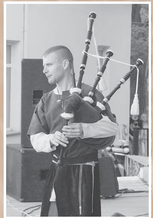
Звучит шотландская волынка. Фолкгрупа «SpieleBanD»