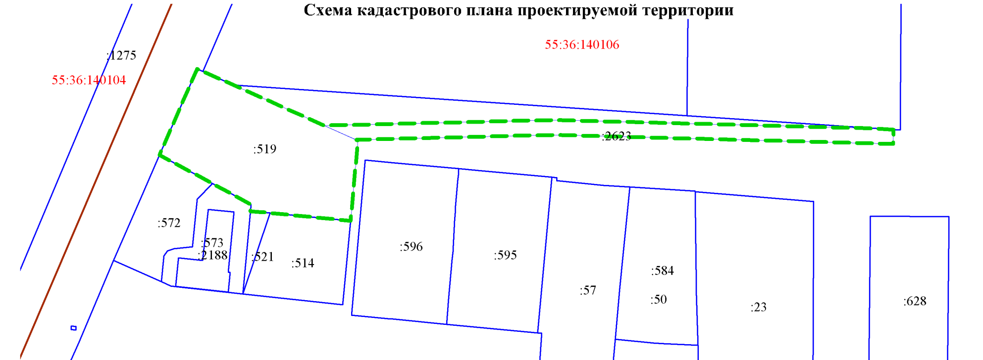
Схема кадастрового плана проектируемой территории