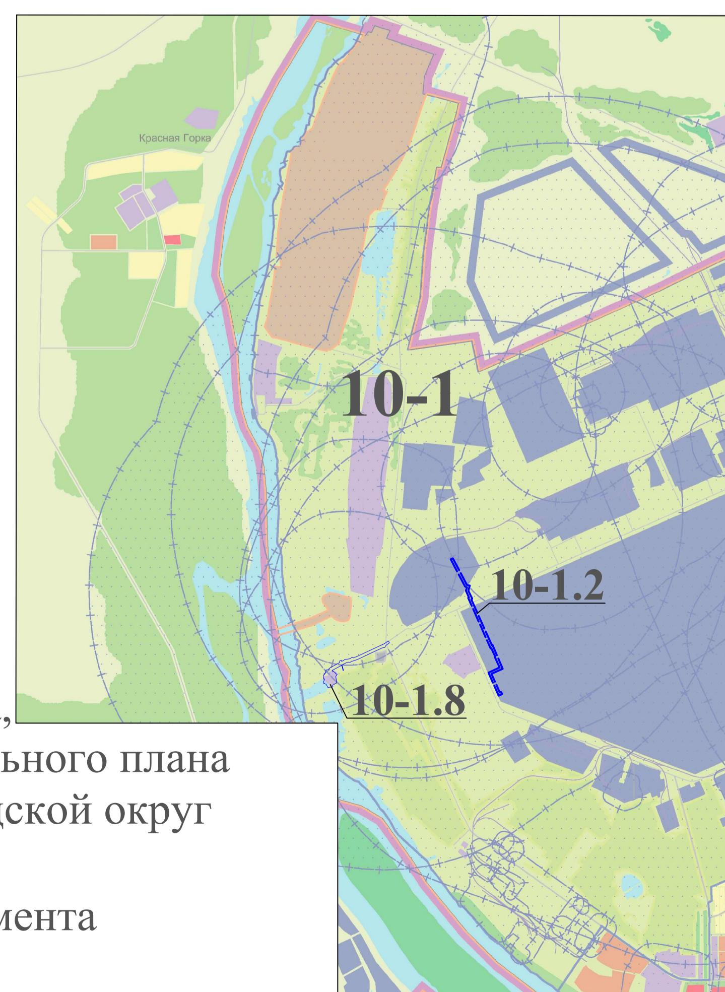
Схема расположения элементов планировочной структуры