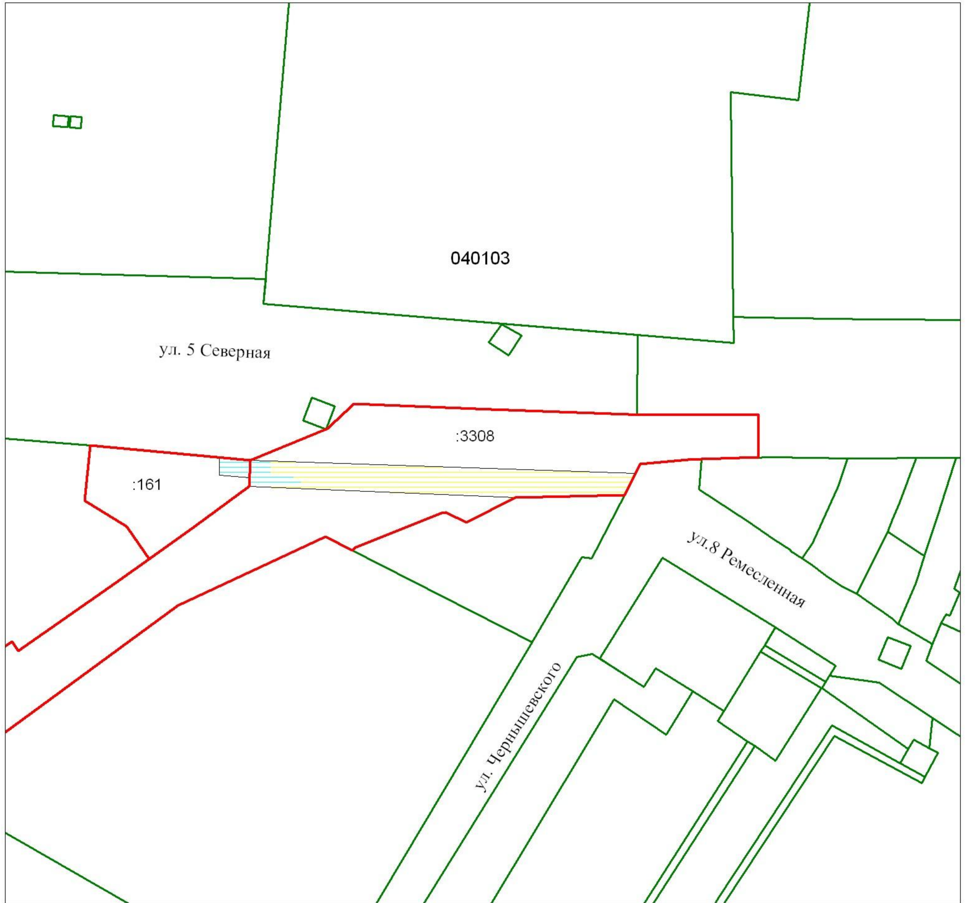
СХЕМА ЗЕМЕЛЬНЫХ УЧАСТКОВ, в отношении которых планируется установление срочных публичных сервитутов в целях прокладки электрических линий и сетей, в Центральном административном округе города Омска