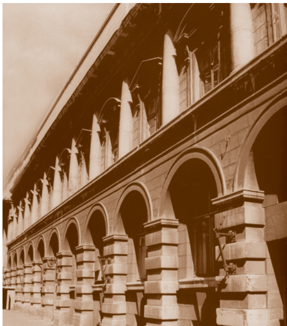
Бывший дом товарищества Российско-Американской мануфактуры «Треугольник» на Гасфортовской улице. 1915.