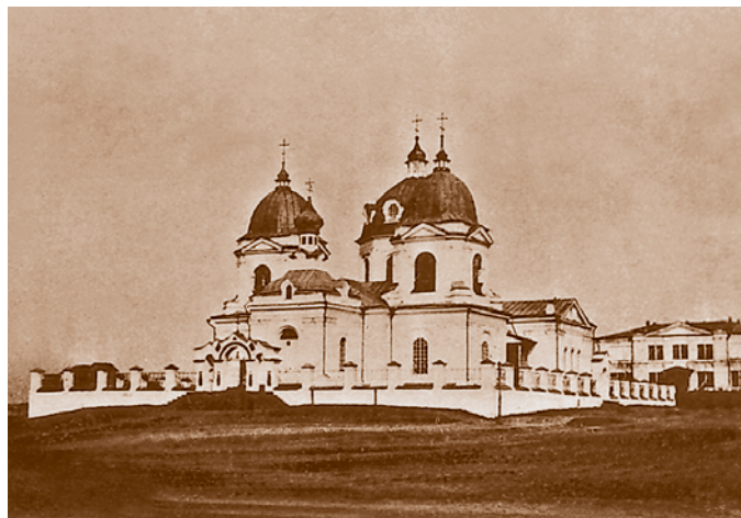
Ильинская церковь. 1778–1789. Открытка 1911 г. Снесена в середине 1930-х гг.