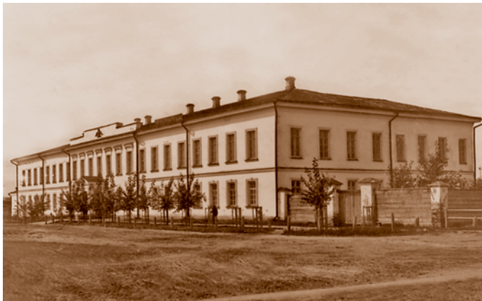
Здание Главного управления Западной Сибири на углу улиц Капцевича (Капцевичевой) и Александровской. В 1918–1919 гг. было занято министерствами Временного Сибирского правительства, затем Министерством внутренних дел Российского правительства, сейчас административное здание (ул. Красный Путь, 7а)

отмечал И. Завалишин. Протяженное двухэтажное классицистическое здание присутственных мест в северной части Омска символизировало собой чиновничий город.