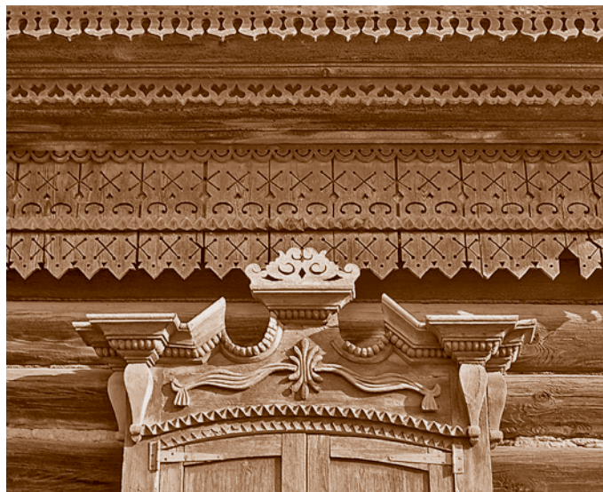
Символика древних славян на резном «свисающем» фризе жилого дома по Тобольской улице*. Вторая половина XIX в. (сейчас – ул. Орджоникидзе, 89)

Хворин, выпускник Петербургского строительного училища (позднее институт гражданских инженеров), приехал в Омск в 1894 г. уже зрелым мастером. Здесь он