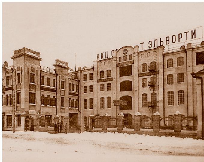
Комплекс зданий акционерного общества сельскохозяйственных машин «Р. и Т. Эльворти». 1914. Масштабная даже по сегодняшним меркам постройка, заставляющая вспомнить европейские средневековые замки. В убранстве фасада использован мотив солнца – намек на архитектуру древних египетских храмов. Сейчас – Омский филиал Внешторгбанка (ул. Тарская, 6)