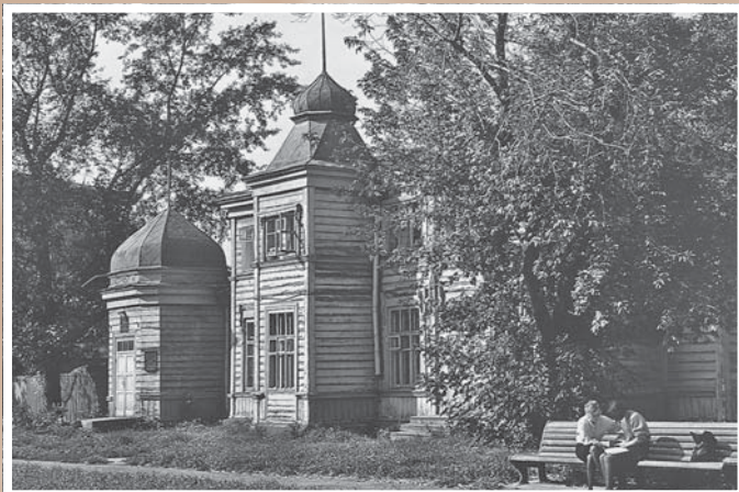
Дом по ул. Музейной, 3*. 1895–1900.

Использованы черты классической европейской архитектуры, элементы древнерусского зодчества и стилизованные в восточном духе формы. Строился для Западно-Сибирского отдела Русского географического общества и первого в городе общедоступного музея. Сейчас – Государственный центр народного творчества