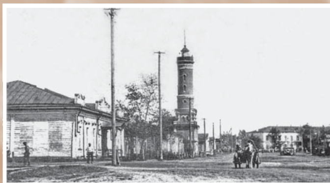
Пожарная каланча на Александровской улице (1914–1915).

Использованы элементы различных архитектурных стилей. Построено на деньги купца Г. В. Терехова как гостиничный комплекс «Россия» для почетных гостей города. Первый этаж занимали магазины. В 1924-м – Дворец труда, затем гостиница «Октябрь», в 1942-м – госпиталь, с 1950-х – вновь гостиница (ул. Партизанская, 2)