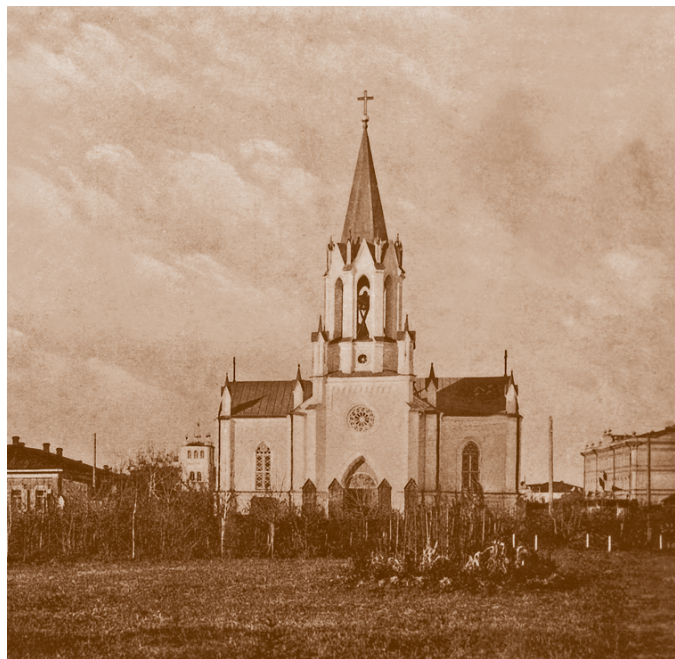
Костел – римско-католическая церковь на углу Новой и Костельной улиц. Открытка 1910-х гг.

Костел был возведен на площади у Никольского казачьего собора между зданиями Общественного собрания и мечети. В интерьере были прекрасный иконостас работы ссыльных поляков и орган. В 1889 г. прихожане-католики обратились с прошением построить колокольню в честь ознаменования «чудесного спасения драгоценной жизни Их Императорских Величеств и Августейшего Семейства от опасности, угрожавшей при крушении императорского поезда 17 октября минувшего года на Харьковско-Азовской железной дороге». Вскоре появилась небольшая колокольня, выполненная в стилистическом единстве с костелом – проемы в форме стрельчатых арок, башенки и другие элементы декора. С западной стороны был построен придел для ризницы с архивом.