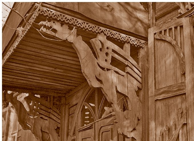
Грифоны – отголоски магической символики древних славян в омской домовой резьбе*. Жилой дом начала XX в. на Кирпичной улице (сейчас – ул. Мичурина, 48)