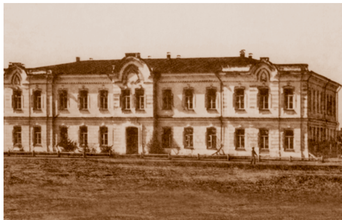
Пансион 1-й женской гимназии. 1883. Открытка начала XX в. Сейчас – торгово-офисное здание (ул. Ленина, 10)

и при этом – с соблюдением чувства меры» (Из XVIII века – в век XXI: история Омска / Н. И. Миненко, В. Г. Рыженко. СПб., 2008. С. 143–144).