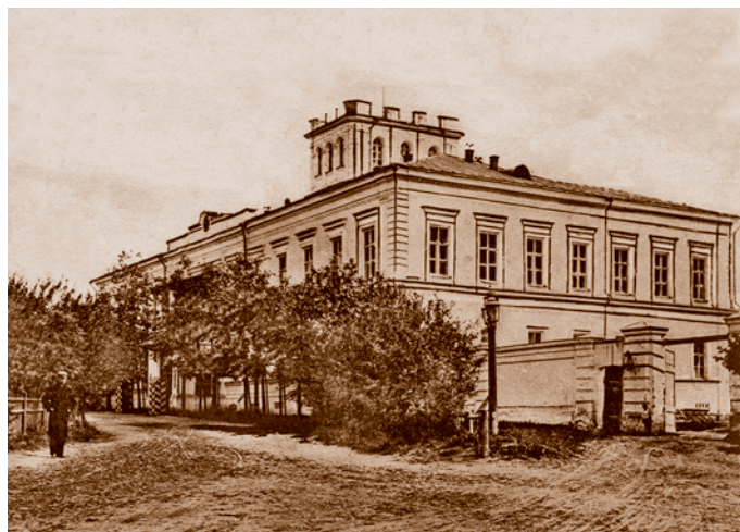
Здание генерал-губернаторского дворца. В 1917 г. – Дом Республики, в 1918-м – Дом Свободы. Сейчас – Омский областной музей изобразительных искусств им. М. А. Врубеля (ул. Ленина, 23)

В губернаторском доме имелись «царские комнаты» на случай приезда членов императорской семьи. Мебель, бронзу и другие предметы интерьера для них пожертвовали владельцы акцизно-откупных комиссионерств в Западной Сибири, меценаты Н. Г. Рюмин и И. Ф. Базилевский. На их же средства в 1859–1860 гг. было возведено здание для Благородного собрания, выполненное в стиле классицизма и в 1906 г. украшенное барочно-рокайльными аттиками,