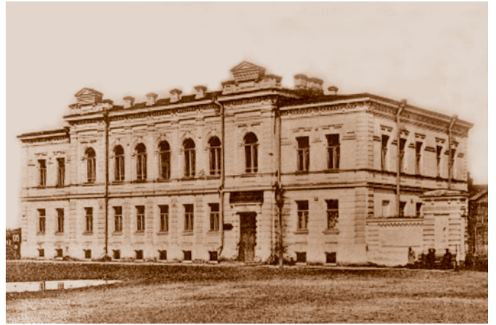
Здание Омского отделения Государственного банка (с 1997 г. здесь находится Головной расчетно-кассовый центр Главного управления Центрального банка РФ по Омской области).