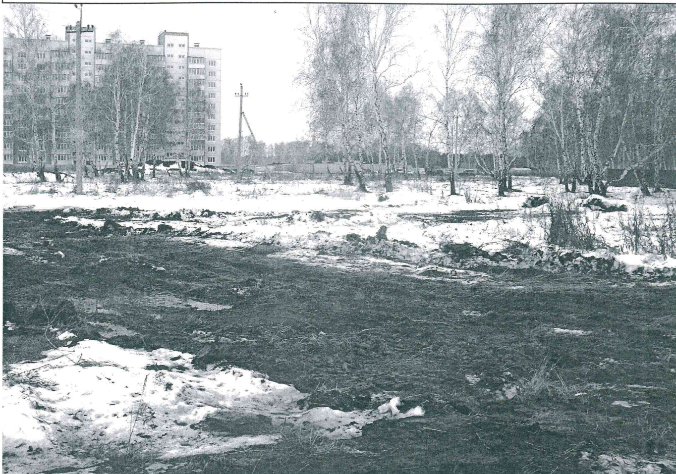
Земельный участок с кадастровым номером 55:36:170110:3188, предоставленный в ГОО «Омское общество автомобилистов» по договору аренды № ДГУ-Л-35-2286 для строительства наземного многоэтажного гаража-стоянки с СТО