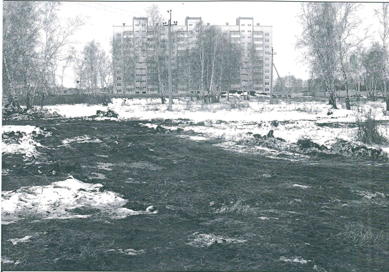
Земельный участок с кадастровым номером 55:36:170110:3188, предоставленный в ГОО «Омское общество автомобилистов» по договору аренды № ДГУ-Л-35-2286 для строительства наземного многоэтажного гаража-стоянки с СТО