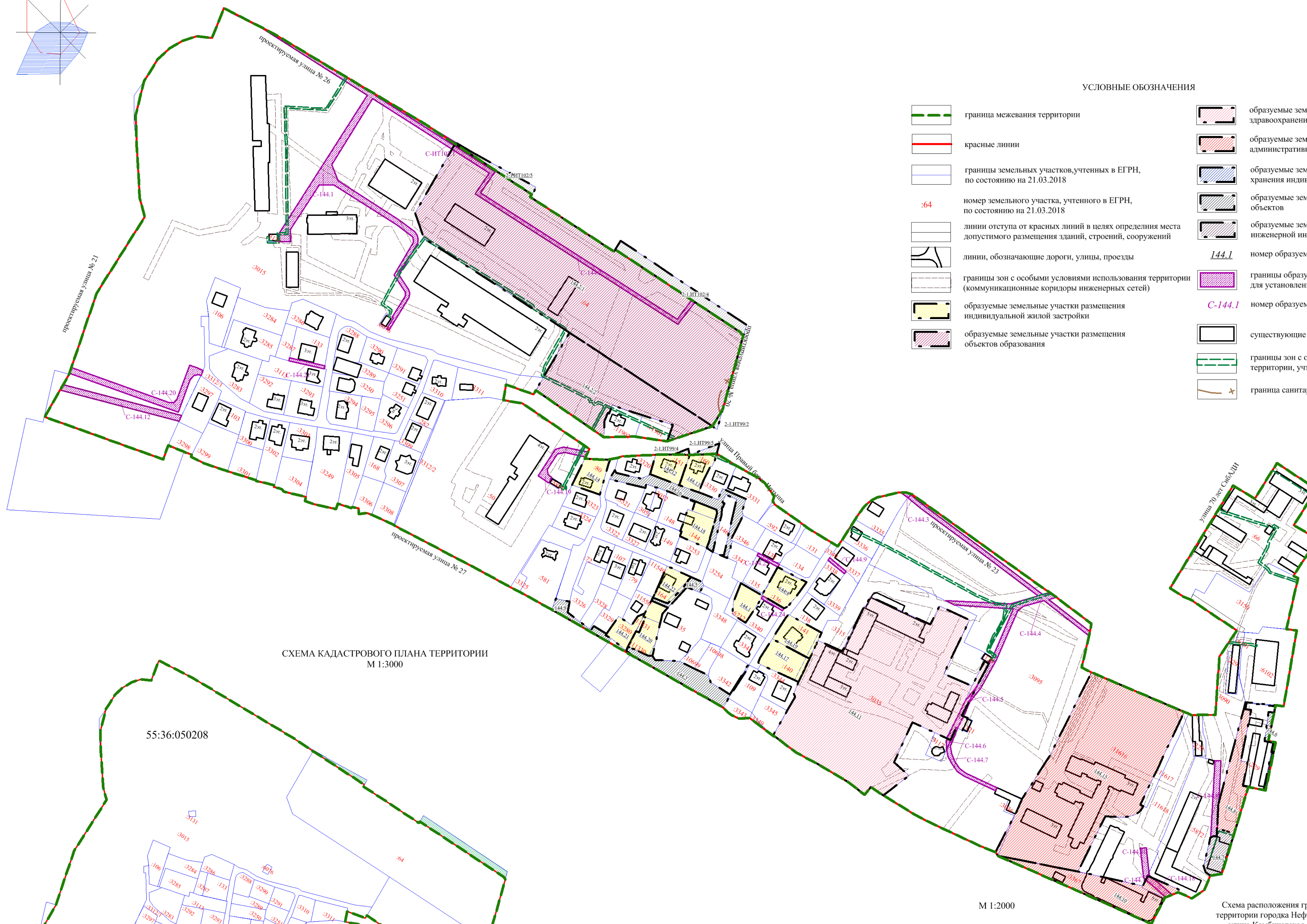
СХЕМА КАДАСТРОВОГО ПЛАНА ТЕРРИТОРИИ М 1:3000