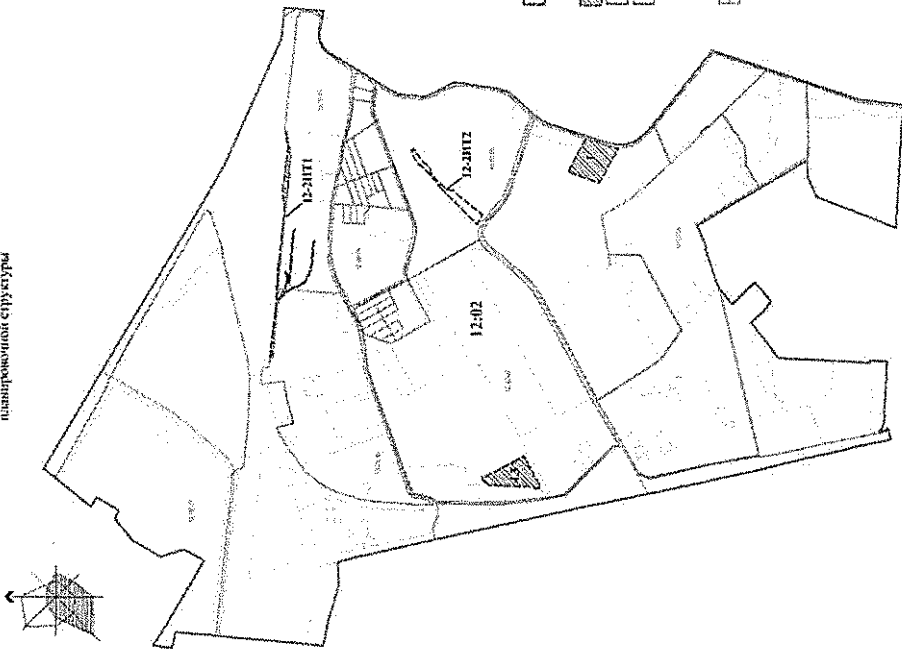
Чертеж межевания территории в границах земельных участков с кадастровыми номерами 55:36:190102:3401, 55:36:190102:3376 в Кировском административном округе города Омска