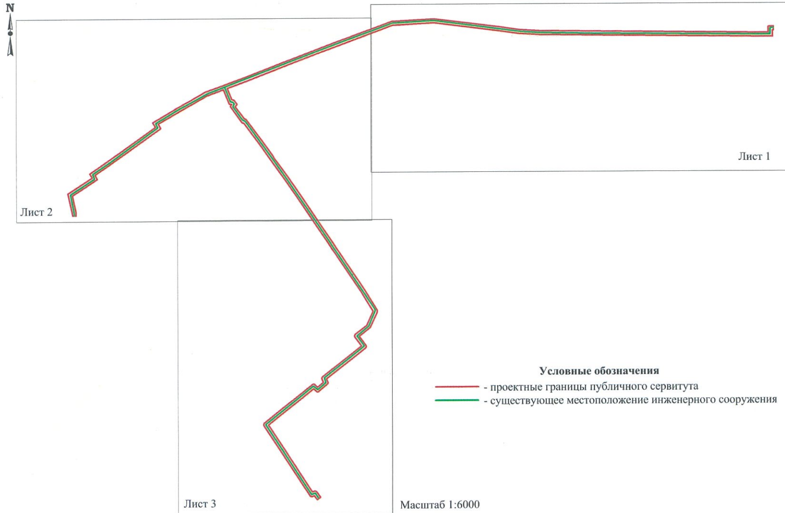
СХЕМА расположения границ публичного сервитута