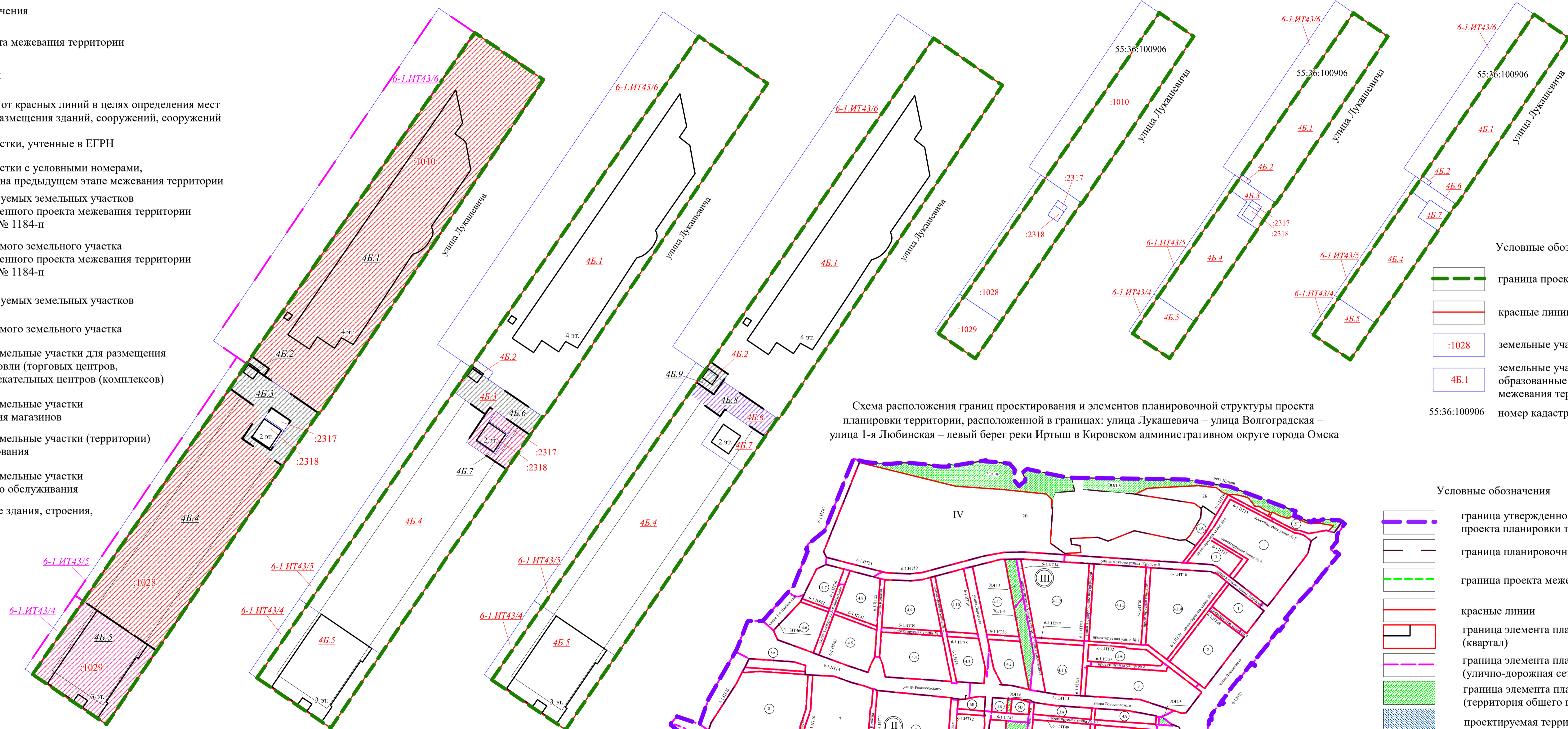
Схема расположения границ проектирования и элементов планировочной структуры проекта планировки территории, расположенной в границах: улица Лукашевича – улица Волгоградская – улица 1-я Любинская – левый берег реки Иртыш в Кировском административном округе города Омска