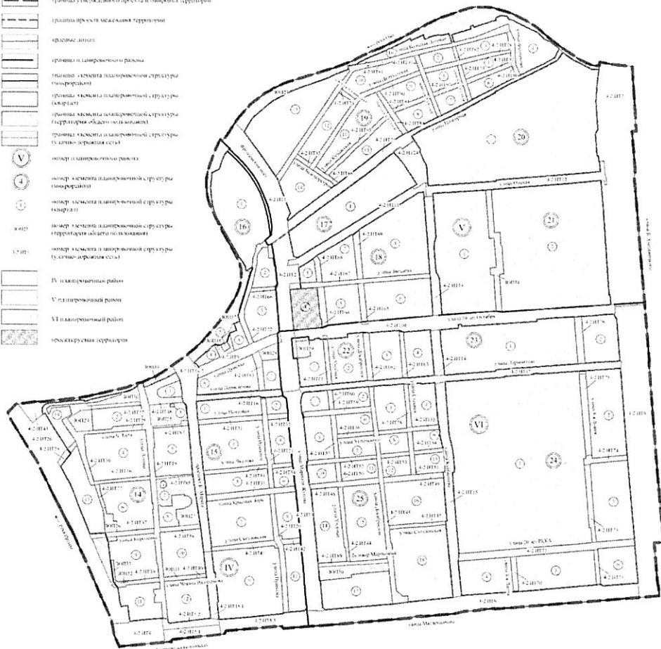
Схема кадастрового плана территории М 1:2000