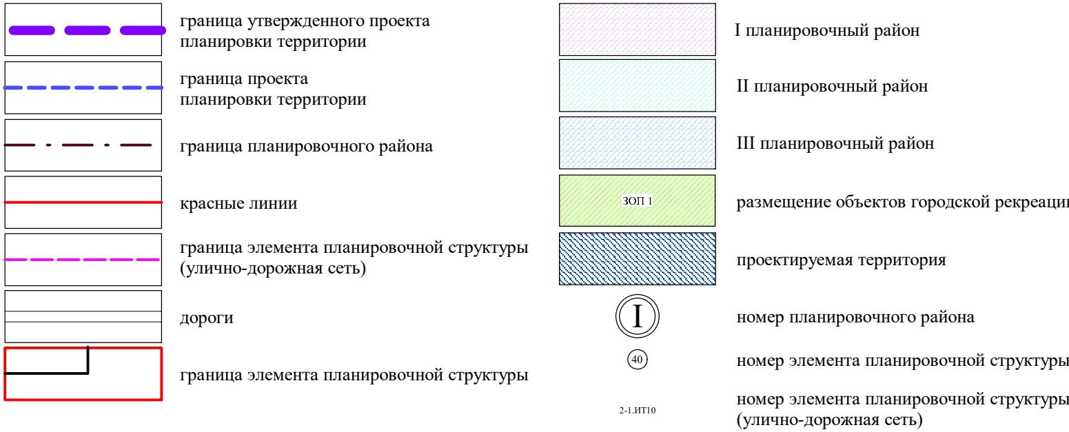
Экспликация зон элемента планировочной структуры № 40 планировочного района I