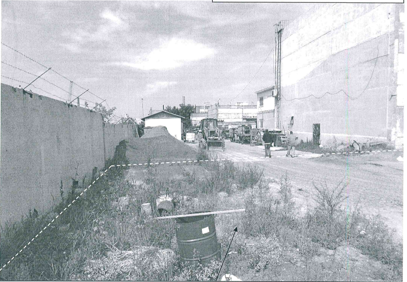
Земельный участок с кадастровым номером 55:36:080116:2043, предоставленный в аренду Свириденко М.П. для строительства холодного склада для хранения сыпучих материалов