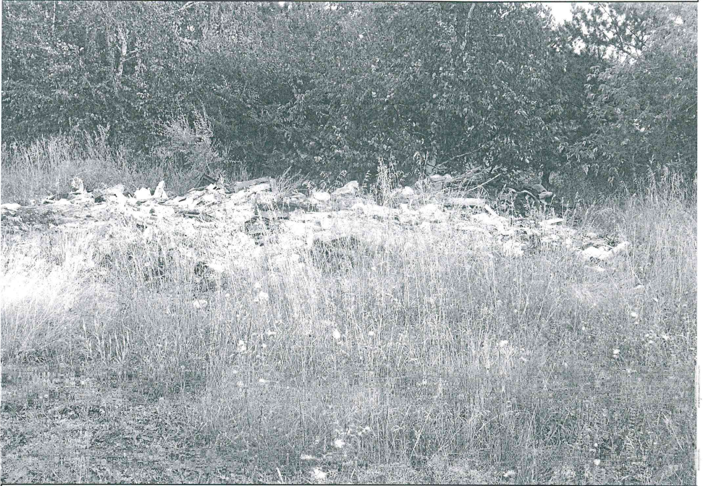
Земельный участок с кадастровым номером 55:36:130126:4359, предназначенный для строительства автозаправочной станции, ООО «Аметист» не используется