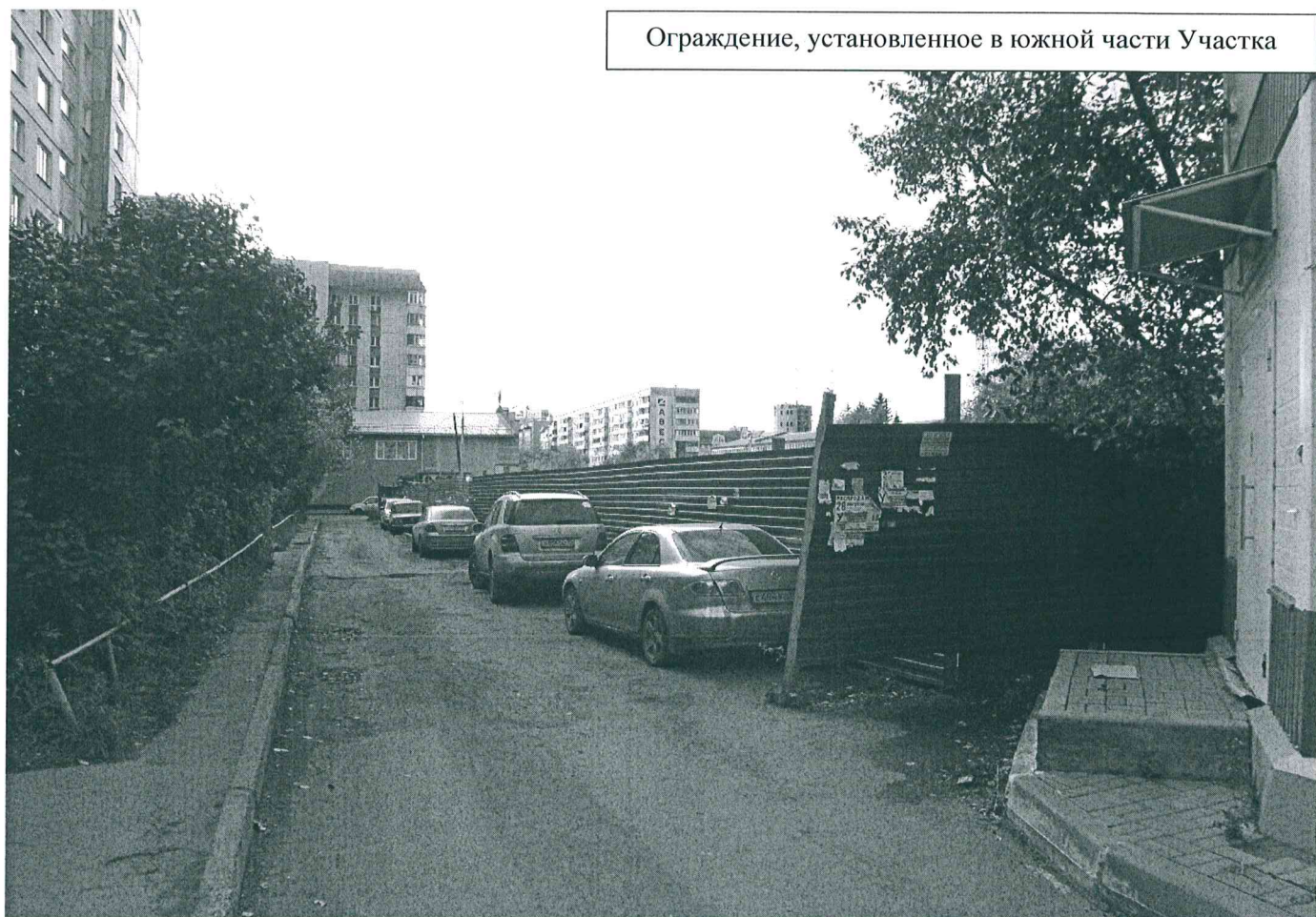
Ограждение, установленное в южной части Участка