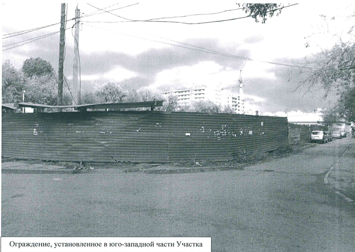
Ограждение, установленное в юго-западной части Участка