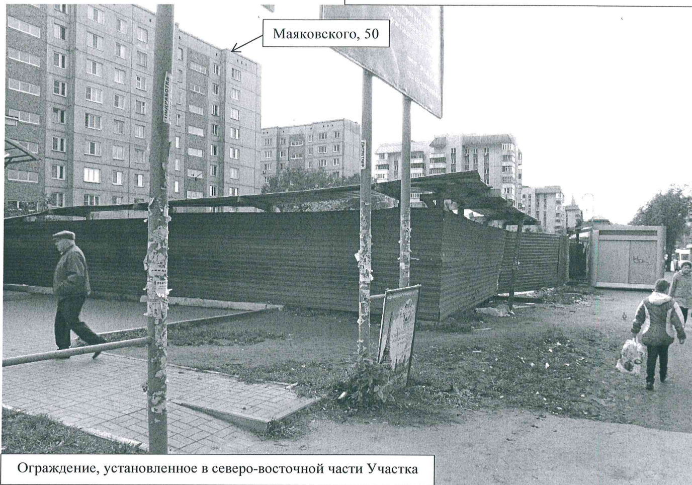
Ограждение, установленное в северо-восточной части Участка