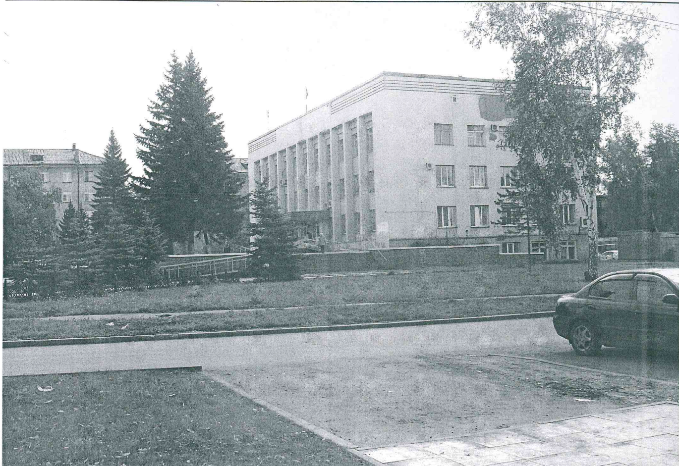
Земельный участок с кадастровым номером 55:36:050208:3278, предназначенный для строительства торгово-офисного здания, предоставленный в ООО «Магазин № 544» по договору аренды № Д-С-31-9198