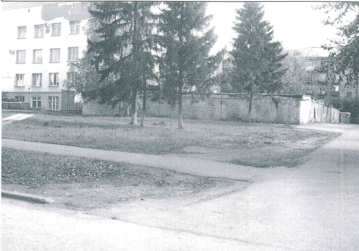
Земельный участок с кадастровым номером 55:36:050208:3278, предназначенный для строительства торгово-офисного здания, предоставленный в ООО «Магазин № 544» по договору аренды № Д-С-31-9198