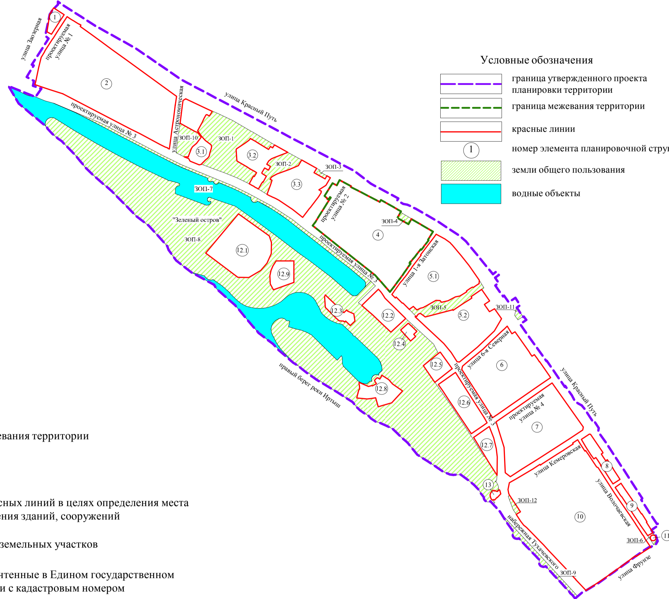
Схема расположения элементов планировочной структуры проекта планировки территории, расположенной в границах: улица Заозерная – улица Красный Путь – улица Фрунзе – правый берег реки Иртыш – в Советском и Центральном административных округах города Омска