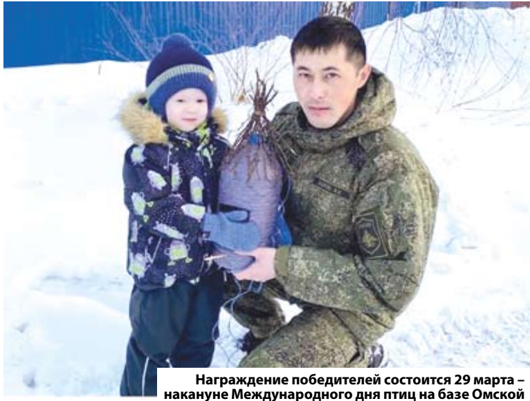
Награждение победителей состоится 29 марта – накануне Международного дня птиц на базе Омской областной станции юных натуралистов.

Фото и видео конкурсных работ необходимо размещать в группе «Кировская молодежь» социальной сети «ВКонтакте» https://vk.com/club195281780 . Более подробную информацию об акции можно получить по т. 55-16-78.