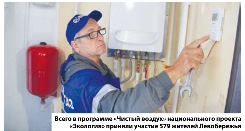
Всего в программе «Чистый воздух» национального проекта «Экология» приняли участие 579 жителей Левобережья

Приём граждан осуществляется по адресу ул. Профинтерна, 15, каб. 314, т. 55-14-86 (вторник и четверг, с 14:00 до 17:00).