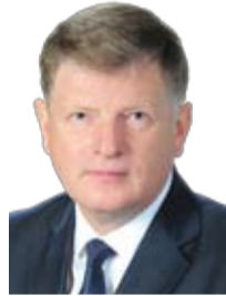
Председатель Омского городского Совета В. В. Корбут