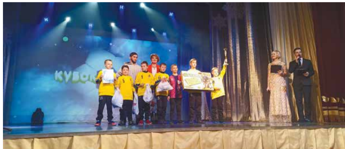
Победители турнира получили памятные подарки