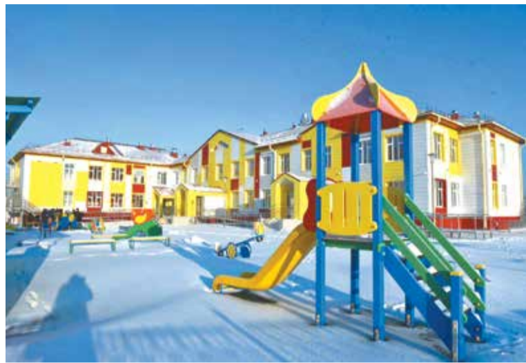
Детский сад на улице Светловской

Как сообщили в департаменте строительства омской мэрии, при проектировании дошкольных учреждений в Омске используется комплексный подход к благоустройству прилегающей территории и организации доступной среды. Для удобства родителей в 2021 году по нацпроекту «Безо-