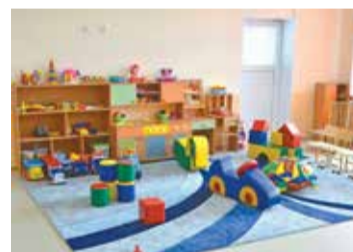
Детские сады обеспечены оборудованием и игрушками

Кроме того, в 2020 году были выполнены ремонтные работы для открытия 13 дополнительных групп на 250 мест для детей до 3 лет в 13 в действующих детских садах.