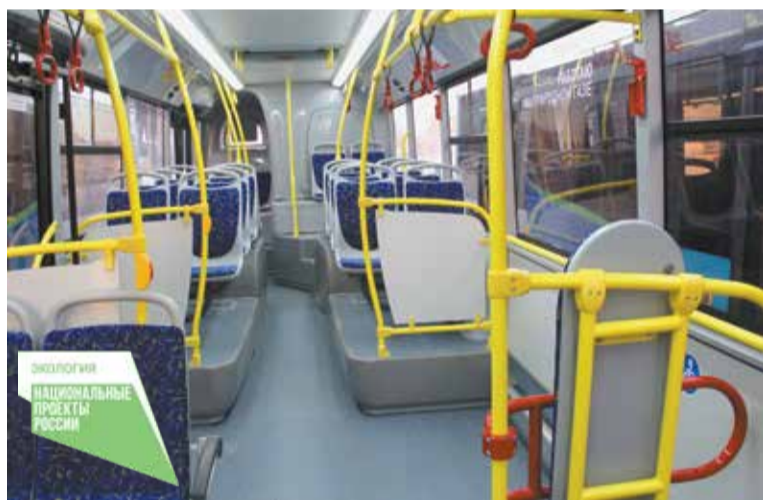
В автобусах ЛиАЗ просторные накопительные площадки

Отметим, что автобусы ЛиАЗ 529267 полностью низкопольные, что позволяет кондуктору и пассажирам безопасно перемещаться по всей длине салона, а также обеспечивает более быстрый пассажирооборот на остановочных пунктах. Пневматическая система наклона кузова делает посадку и высадку из автобуса комфортной, а в совокупности с откидной аппарелью максимально облегчит доступ в автобус людей с ограниченными возможностями. С внешней стороны автобусы оборудованы кнопками вызова водителя, а в центральной части салона расположено специальное место для колясок.