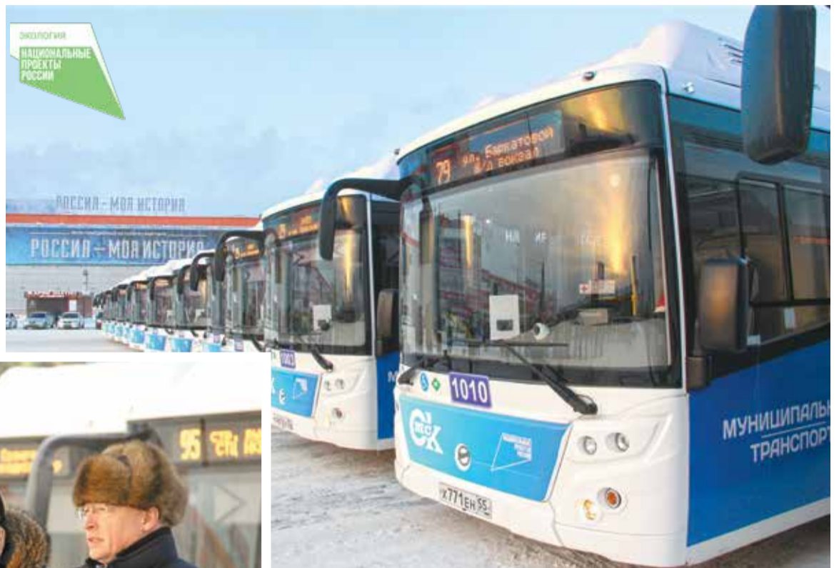
Новые автобусы работают на природном газе

лям я желаю чистых и ровных дорог и хороших, добрых, позитивных пассажиров».