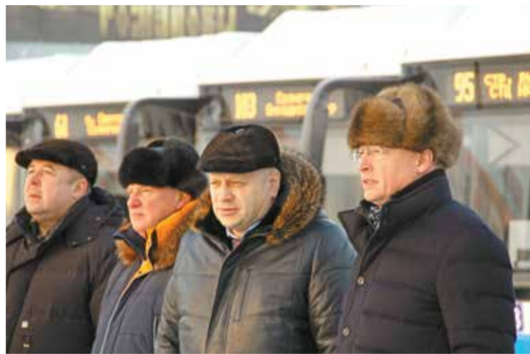
Руководители города и области на презентации автобусов

обновление уже произведено наполовину. И вот сегодня мы вручаем 51 автобус большой вместимости – очень теплые, комфортные средства передвижения. Дорогие друзья, я еще раз поздравляю жителей Омска, всех тех гостей, которые будут пользоваться этим прекрасным автотранспортом. Ну а водите-