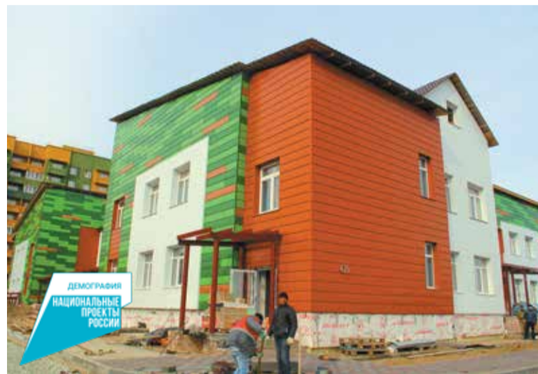
Детский сад на улице 1-й Станционной

В рамках национального проекта «Демография» в Омске сейчас завершается строительство еще двух детских садов. Это учреждения в микрорайоне Прибрежный (на 260 мест) и в микрорайоне Большие Поля (на 140 мест).