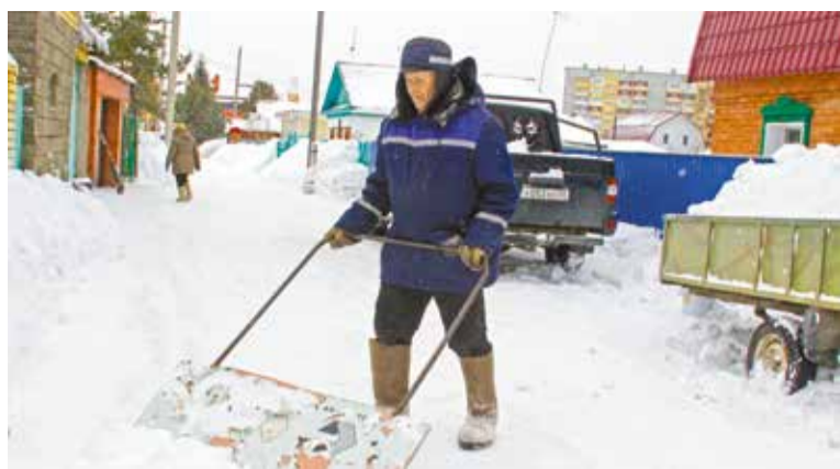
Жителям частного сектора необходимо вывезти снег с придомовой территории на снежные полигоны

В целях предотвращения подтоплений придомовых территорий многоквартирных домов управля-