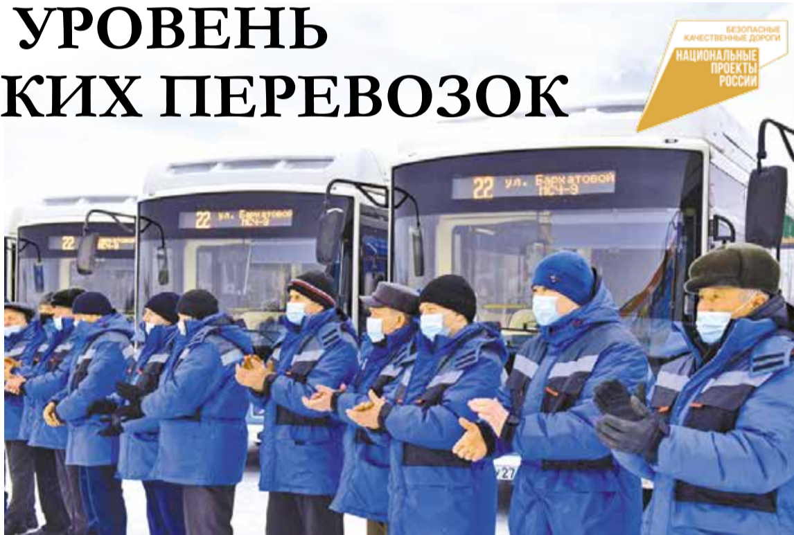
Новые автобусы «VOLGABUS Ситиритм» стали подарком не только для омичей, но и для водителей

Омичи, которые регулярно пользуются общественным транспортом, уже смогли по достоинству оценить новые машины, работающие на городских маршрутах. Это 20 автобусов НефАЗ, 100 автобусов ПАЗ, 100 автобусов малого класса «Луидор», приобретенные в 2018 году.