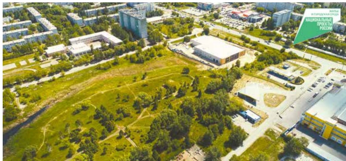
В этом году на бульваре им. Веретено появятся дорожки, линии наружного освещения, малые архитектурные формы, спортивная площадка

в апреле. Подрядные организации должны приступить к подготовительным работам на территориях уже весной, по условиям контрак-