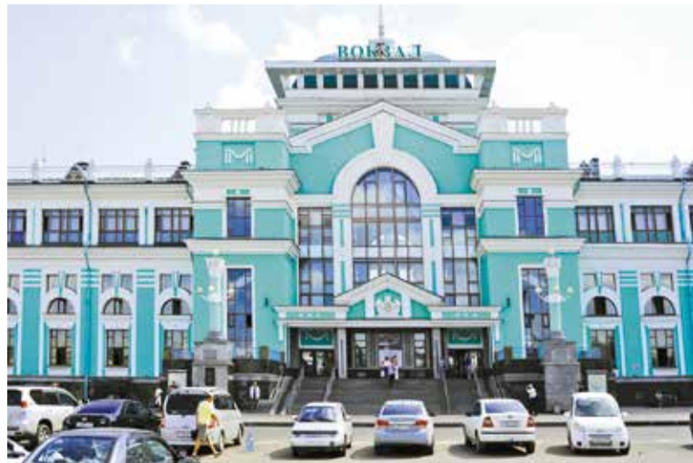
Современное здание Омского железнодорожного вокзала

Подготовлено при участии заведующей музеем омских железнодорожников М. Г. Пархоменко