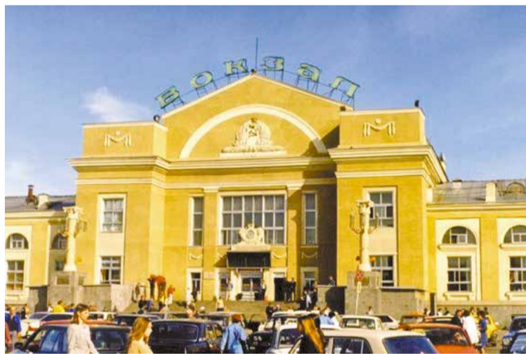
Здание вокзала в традициях сталинского классицизма. Конец 1980-х

Залы ожидания стали просторнее и были предназначены отдельно для пассажиров I и II класса и для пассажиров III класса. С 1909 года на вокзале уже работал телефон. Для пассажиров также работали парикмахерская, буфет, особые камеры для хранения багажа и ручной клади, газетные киоски и книжные шкафы. Завершено строительство вокзала было к 1914 году.