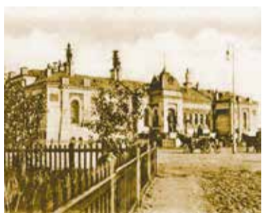
Станция Омск Сибирской железной дороги. Конец XIX в.

С 1895 года через станцию Омск-Пассажирский пошла поездка от Челябинска до Кривошеково. Полгода после начала рабочего движения поезда переправлялись через Иртыш на пароме, но с 1896 года после ввода в эксплуатацию железнодорожного моста движение стало непрерывным. Тогда же, в марте, распахнул для посетителя свои двери и первый Омский железнодорожный вокзал.