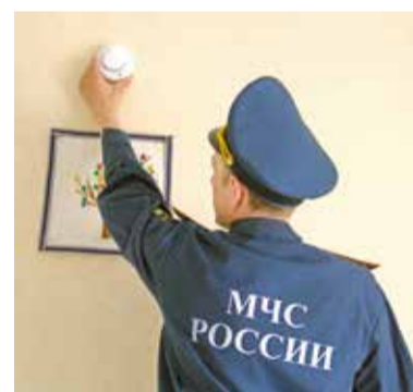
Извещатели – эффективная защита от пожара

Установленные датчики показали свою эффективность: за все время эксплуатации (с 2018 года) на территории Омской области они сработали 1237 раз. Именно своевременные сигналы АПИ позволили спасти 16 человек, из них 7 детей.