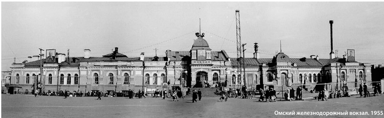
Омский железнодорожный вокзал. 1955

Детская школа искусств № 20 открылась в 2014 году. В настоящее время она является единственным учреждением дополнительного образования на территории микрорайона Порт-Артур.