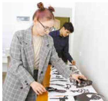
Ребята освоили новый для себя вид искусства