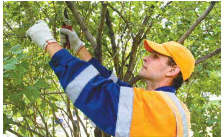
На снос, обрезку и восстановление зеленых насаждений необходимо получить разрешительные документы

Для получения разрешения на снос или обрезку деревьев на прилегающей к дому территории необходимо обратиться в комиссию администрации Ленинского округа по сносу, обрезке и восстановлению зеленых насаждений по адресу: пр. К. Маркса, 62, каб. 410, тел.: 41-52-01.