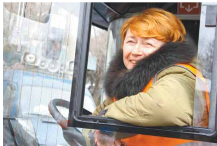
Водители довольны новыми машинами

Работники предприятия имеют право бесплатного проезда в городском муниципальном транспорте. Большое внимание уделяется социальным вопро-