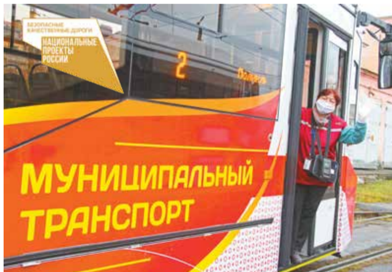
Сегодня на электрическом транспорте трудится более 1500 человек

включает в себя проверку умения управлять троллейбусом/трамваем в условиях дорожного движения и проверку теоретических знаний. При успешной сдаче экзаменов обучающиеся зачисляются в штат предприятия водителями третьего класса. Им назначается пассажирская